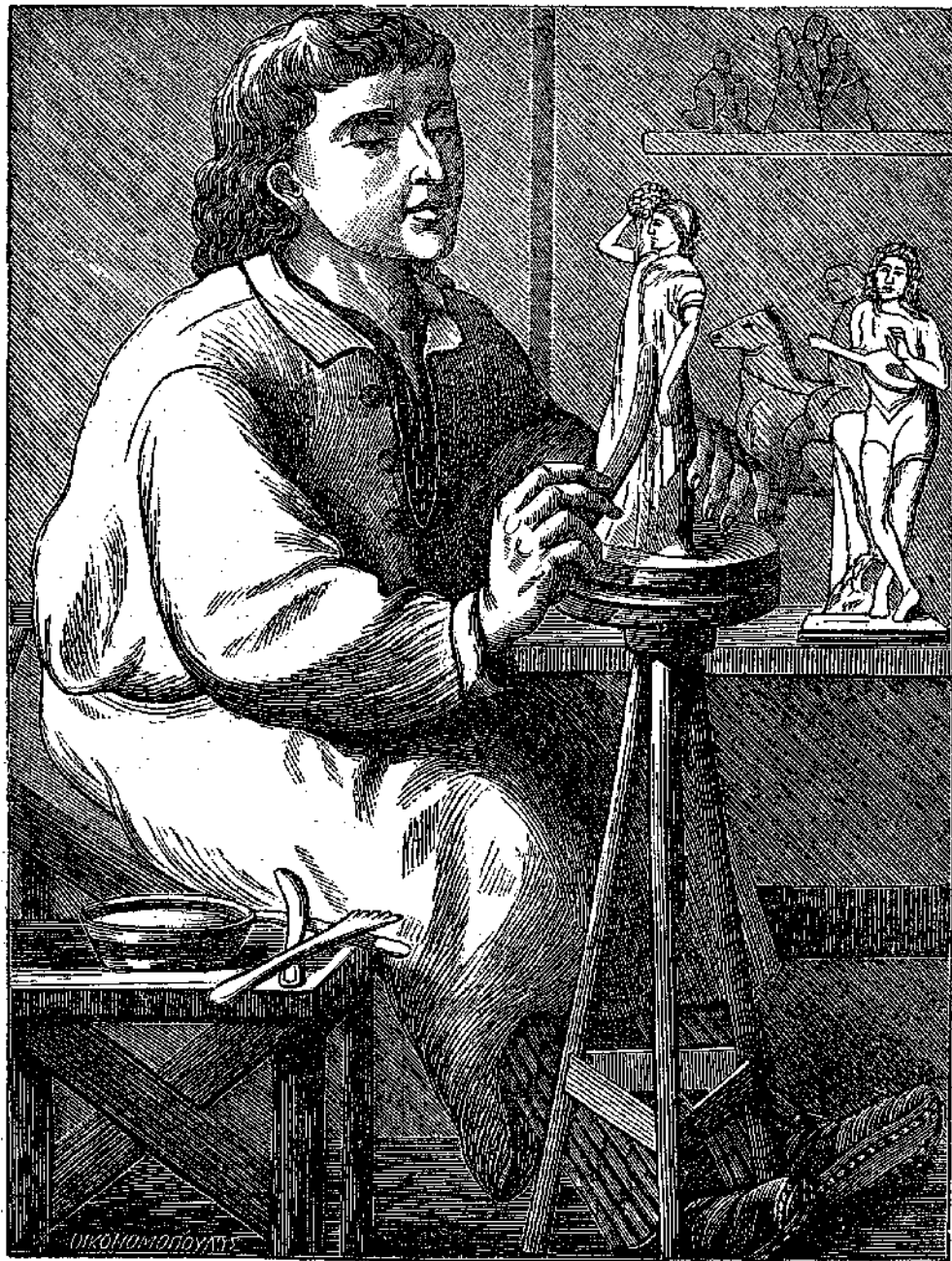
Ὁ τυφλὸς γλωττῆς.

Ποσᾶκις δὲν ἤρχισας κάτι τι μὲ τὴν ἀπόφασιν νὰ τὸ τελειώσῃς, ἀλλὰ ἀπέκαμες ἄμέσως εἰς τὴν ἀρχὴν, ἢ ἐβαρύνθης περὶ τὸ τέλος, τοιοτοτρόπως δὲ ἤναγκάσθης νὰ νομίσης ἀκατόρθωτον τὴν ἐπιχείρησίν σου, ἢ ἀνίκανον τὸν ἑαυτὸν σου εἰς ἐκτέλεσιν τοιοῦτου ἔργου· ἐὰν δὲ ἀπὸ ἐρωτισμὸν δὲν ἠθέλησας νὰ ἠμολογήσῃς τὴν ἐκ τῆς ἐπιπολαιότητός σου ἀνικανότητα, ποσᾶκις δὲν προσεπάθῃσας νὰ πείσῃς τοὺς φίλους σου, διὰ λόγων μόνον, ὅτι δύνασαι μὲν νὰ φέρῃς εἰς πέρας τὸ ἔργον, ἀλλὰ δὲν κρίνεις φρόνιμον νὰ καταγίνεσαι εἰς τόσο ποταπὰ πρᾶγματα!—Δὲν εἶναι ἀληθές, οὔτε τὸ ἐν οὔτε τὸ ἄλλο· οὔτε ἀνίκανος δηλαδὴ εἶσαι, οὔτε μὲ πεποῖθησαι περιφρονεῖς τὸ ἔργον· Ἡ ἀλήθεια εἶναι ὅτι δὲν ἔχεις θέλησιν, δὲν ἔχεις ἐπιμονὴν, δὲν ἐσυνείδησας νὰ λαμβάνῃς σταθερὰν ἀπόφασιν. Ὁ ἔχων ὑπομονὴν καὶ ἐπιμονὴν εἰς πρᾶγματα, ἐννοεῖται, δι-