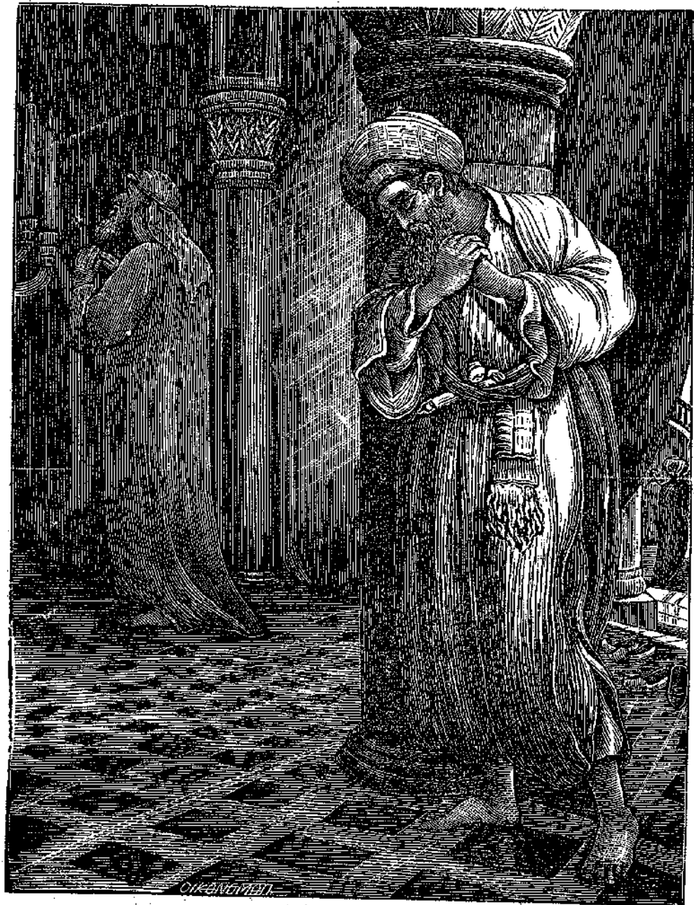
Ὁ Τελώνης καὶ Φαρισαῖος.