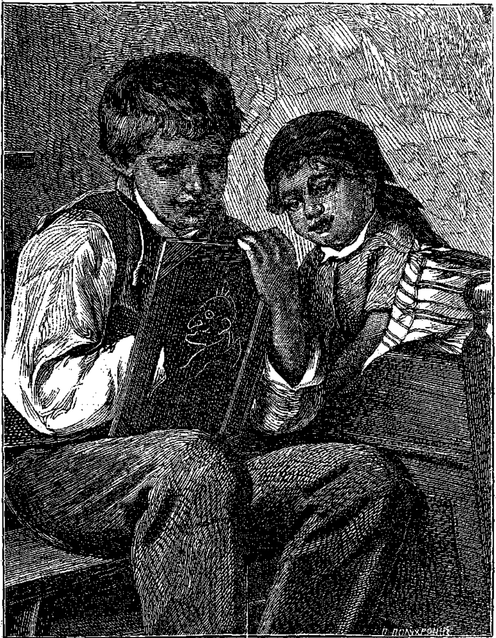
Σωγραφίζει χιλιοστήν ἤδη φοράν τήν εἰκόνα τῆς ἀδελφῆς του.