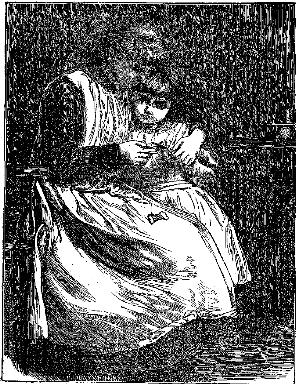
Ἡ Σαπφὴ περιέβαλε διὰ τῶν βραχιόνων τῆς τὴν μικρὰν ἀδελφῆν τῆς.

— Δὲν λέγω ὅχι· ἀλλὰ περισσότερο τὰς ἰδικὰς σου πράξεις θὰ μιμῆται, διότι σὺ εἶσαι πλησιέστερον πρὸς αὐτὴν κατὰ τὴν ἡλι-