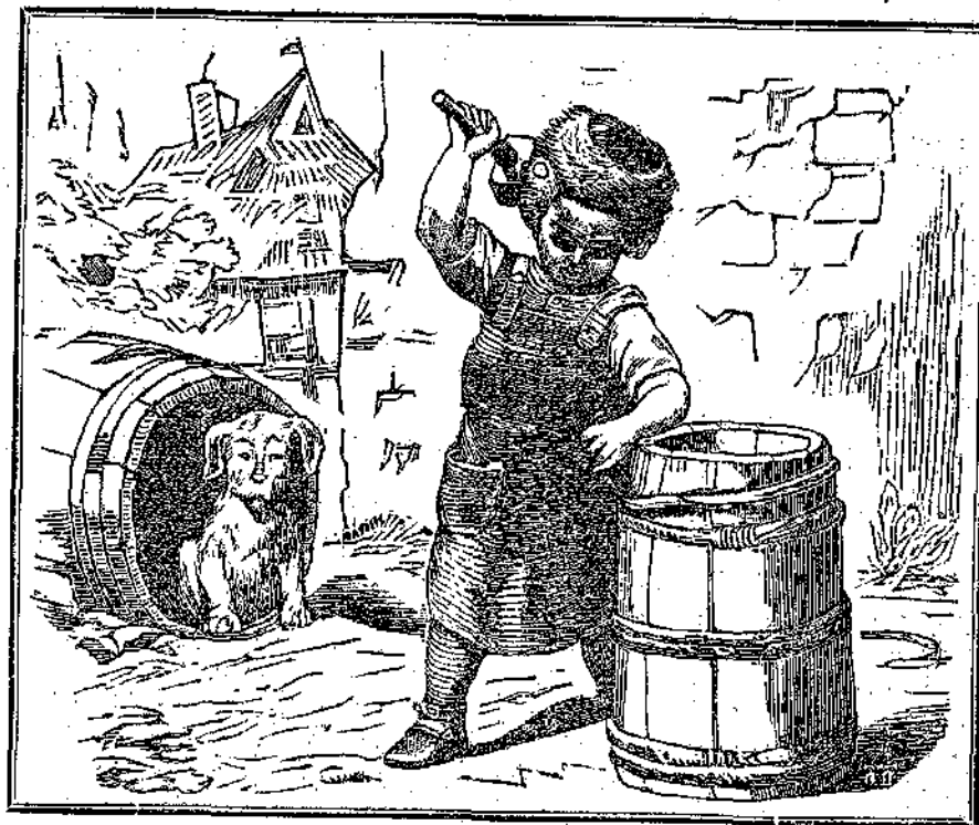
Κτύπα, μικρὸ μου βαρελά, κτύπα τὴν σφήνα!

μικρὸς βαρελάς βιάζεται νὰ τελειώσῃ τὸν κᾶδδον του ὀργήγορα, ὀργήγορα, διὰ νὰ λάβῃ δύο φράγκα διὰ τὸν κόπον του, καὶ μὲ αὐτὰ νὰ ἀποκτήσῃ ἐκεῖνο τὸ ὁποῖον ἀνείροπόλησε ἡμέρας καὶ νύκτας ὀλοκλήρους, ἐκεῖνο διὰ τὸ ὁποῖον τόσον μικρὸς καὶ βαρελάς κατήντησε νὰ γίνῃ: «τὴν Διάπλασιν τῶν παιδίων». Διότι αὐτὸς δὲν εἶνε βαρελάς ἐξ ἐπαγγέλματος· ὄχι! αὐτὸς εἶνε μαθητῆς τῆς ὀγδόης τάξεως καὶ ἐπιμελετὴς μάλιστα, καὶ εὐφύεστατος μαθητῆς. Ἀλλ' ὁ δυστυχῆς