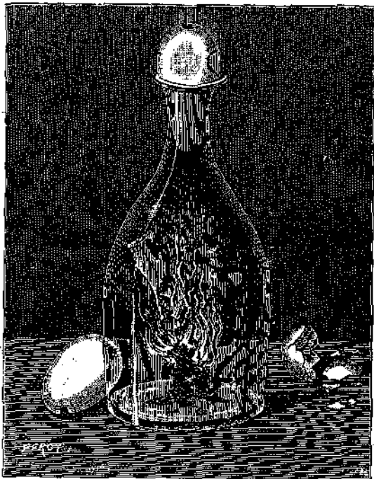
Τὸ ὕδν μὴ κύνεται ἀνεπαισθήτως (*).

Καὶ ἀμέσως λαμβάνομεν φιάλην στεγνὴν ἐντὸς αὐτῆς θέτομεν τεμάχια χαρτίου τὰ ὁποῖα ἀνάπτομεν ἔξω ἀφίνομεν νὰ καίουν μερικὰς στιγμὰς, ἔπειτα, ἐνῶ εἰσέτι καίουν τὰ χαρτῖα, θέτομεν τὸ βρασμένον ὕδν ὡς πῶμα εἰς τὸ στόμιον τῆς φιάλης. Φροντίζομεν νὰ τὴν κλείψῃ στεγανῶς τὸ ὕδν, δηλαδή τὸσον σφιγκτὰ ὥστε νὰ μὴ εἰσέρχεται αὐδ' ἀὴρ ἐντὸς τῆς φιάλης. Τότε ἀρχίζει ἡ μαγεία.