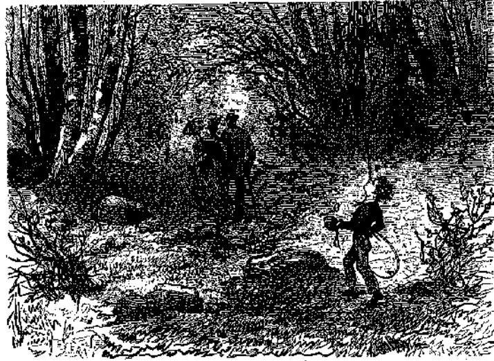
ΠΕΡΙΕΠΛΑΝΗΝΤΟ ΕΝΤΟΣ ΤΟΥ ΔΑΣΟΥΣ (Σελ. 177).

φύτους τριανταφυλλέας, ἐκλιθάριζε τὰ δένδρα, ἐσχεδιάζε δένδροστοιχίας, ἰσοπέδωνε τὸ ἀνώμυλον ἔδαφος, καί δὲν ἐβρύνετο νὰ περιποιῆται καί νὰ προσέχη τὸ μικρὸν τῆς βασιλείου. Ἄν καὶ δὲν ἦτο πολὺ μέγαλον, διότι εἰς ὀλίγα λεπτὰ τῆς ὥρας ἠδύνατο νὰ το περιέλθῃ ὅλον, εἰς ἐκείνην ὁμως ἐφαίνετο ἀπέραντον. Ὁ κύριος Γεώργιος