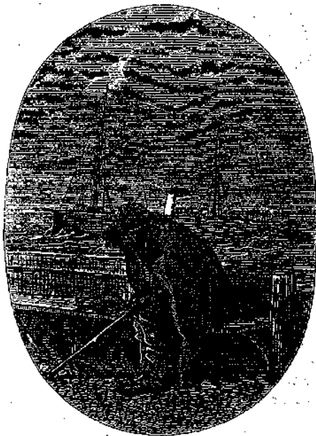
« ΑΠΑΡΗΓΟΡΗΤΟΣ »