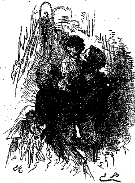
• ΜΑΚΑΡΙΟΙ ΓΟΝΕΙΣ! •

Ἐν ἀνάτιον τὸ ὅποιον ἐχάθη τὴν νύκτα ἐκ τοῦ λιμένος, εὐρέθη εἰς τὸ γαιτοκῶν χωρίον ἔρημον, χωρὶς ἐπιβάτην, πλησίον μικροῦ κολπίσκου. Ταυτοχρόνως ἔγινε γνωστὸν καὶ τὸ ἐξῆς: Πλησίον τοῦ κολπίσκου, ὅπου εὐρέθη τὸ ἔρημον ἀνάτιον, ἦτο μικρὰ καλύβη, εἰς τὴν ὅποιαν ἐκάθητο πτωχὸς ἐργάτης μετὰ τῆς γυναίκας του. Ὁ σύζυγος ἔτυχε νὰ εἶνε ἀρρωστος καὶ ὄλην νύκτα ἡ σύζυγος