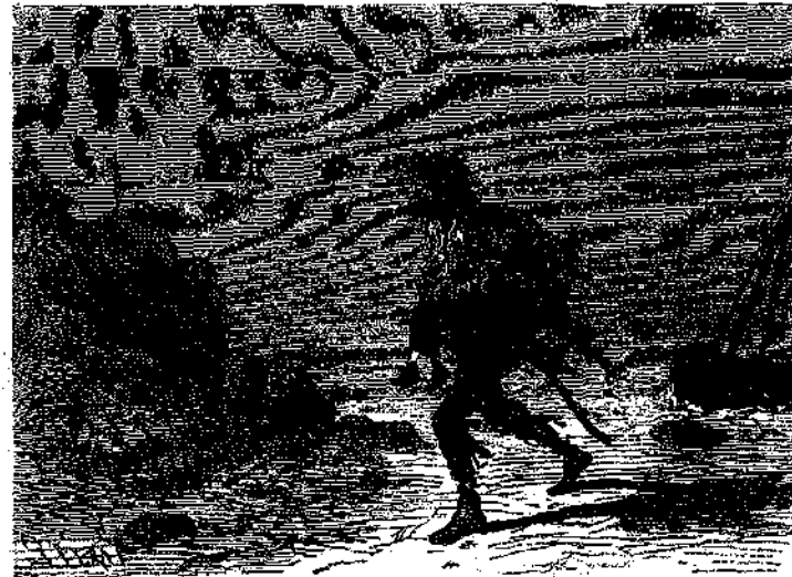
* ἘΤΡΕΧΕ ΦΕΡΩΝ ΤΟ ΠΟΛΥΤΙΜΟΝ ΦΟΡΤΙΟΝ ΤΟΥ. [Σελ. 164]

Περὶ τὸν νὰ εἰπωμεν ὅτι δὲν ἐληγημονήθη καὶ ὁ