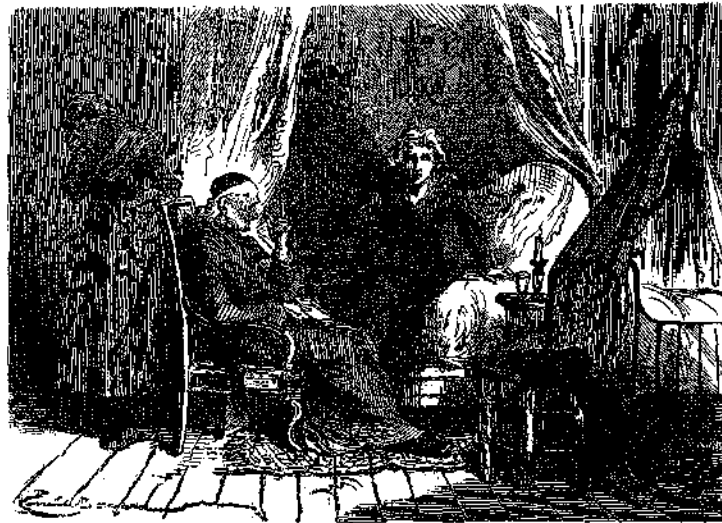
• ΠΑΙΔΙ ΜΟΥ! ΜΑΤΙΑ ΜΟΥ! • (Σελ. 161)

» Χαίρετε καὶ καλὴν ἀντάμειψιν Γεώργιος» — Ἄγισ ἐφημέριε, ἠκούσατε τί γράφει: Ἐρχεται, καὶ πῶς ἐγὼ θὰ τον ἴδω! πάρτε με ἀπ' ἐδῶ, κρύφατέ με πουθενά, διότι ἐντὸς μᾶς ὄρας θὰ εἶνε ἐδῶ! Καὶ τί νὰ του εἰπῶ ὅταν μ' ἐρωτήσῃ διὰ τὸ παιδί του; νὰ του εἰπῶ ὅτι δὲν ἔχει πλέον παιδί; ὅτι ἀπέθανεν ὁ Στέφανός του ἀπὸ τὴν ἀμέλειάν μου, ἐν ᾧ ἔπρεπε νὰ τὸ προσέχω καὶ νὰ μὴ το ἀφίνω στιγμὴν ἀπὸ κοντὰ μου; Ἄχ! τί νὰ κάμω; ἔλατε νὰ φυγῶμεν, ἢ καλλίτερα μείνετε καὶ σεῖς μαζί μου, σὰς παρακαλῶ, λυπηθῆτέ με. Ἐγὼ θὰ πάγω νὰ κρυφθῶ, ἢ ὅταν ἔλθῃ πῆτὲ του ὅτι ζῶ ἐγὼ καὶ ὅταν με φωνάξῃ, τότε εὐθὺς ἔρχομαι. Εἴσατε καλῶς, ἄγε ἐφημέριε, καὶ εἰσεύρετε πῶς νὰ ἠμιλῆτε εἰς τοὺς δυστυχεῖς. Πῆτὲ του ὅτι ἐγὼ ζῶ καὶ ὅτι θὰ προσπαθῶ νὰ ὑποφέρω τὴν ζωὴν. Θὰ ζήσωμεν ἐγὼ δι' ἐκεῖνον καὶ ἐκεῖνος δι' ἐμὲ, μὲ τὴν ἐλπίδα ὅτι θὰ εὐρωμεν μίαν ἡμέραν εἰς τὴν ἄλλην ζωὴν τὰ φιλτατὰ μὰς, τὰ ὅποια ἐδῶ ἐχάσαμεν!»