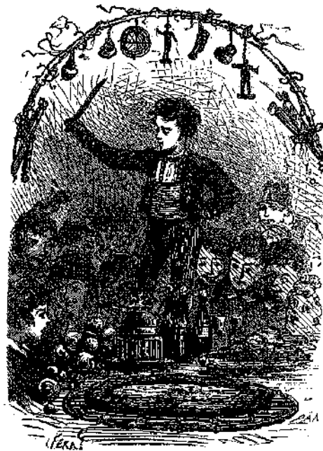
« ΚΑΙ ΣΥΜΠΟΙΕΙΡΧΟΣ » (Σελ. 165)

Πιπιάς. Ἀλλὰ πῶς νὰ τον ἀνταμείψουν αὐτὸν τὸν δυστυχῆ; Κατ' ἀρχὰς ἐσκέφθησαν νὰ του κτίσουν μικρὰν καλύβην, ἢ νὰ τον σταλοῦν εἰς φιλανθρωπικὸν κατάστημα. Ἀλλὰ καὶ τὰ δύο ταῦτα ἦσαν ἀκατόρθωτα, διότι ὁ τάλας Πιπιάς δὲν ἦτο εἰς κατάστασιν νὰ προσέχη τὴν καλύβην του καὶ νὰ την φυλάττη, ὥστε εἰς τίποτε δὲν ἠθελῆ του ὠφελῆσαι. νὰ τον κλείσουν πάλιν εἰς φιλανθρωπικὸν κατάστημα ἦτο τῶν ἀδυνάτων, διότι δὲν ἦτο συνηθισμένος εἰς τὸν καθιστικὸν βίον, αὐτὸς ὄλων τὴν ἡμέραν καὶ τὴν νύκτα ἀκόμη ἐπλανᾶτο ἐπάνω κάτω, μεταβαίνων ἀπὸ τοῦ ἑνὸς χωρίου εἰς τὸ ἄλλο. Περιωρίσθησαν λοιπὸν νὰ τον συστήσουν εἰς τὸν ἐφημέριον τοῦ γειτονικοῦ χωρίου, εἰς τὸν ὁποῖον ἔδωκαν καὶ ἀρκετὸν ποσὸν χρημάτων διὰ νὰ φροντίξῃ διὰ τὰς ἀνάγκας τοῦ ἀτυχοῦς κωφαλάου.