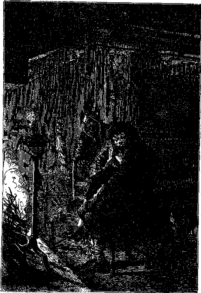
* ἘΚΑΘΙΣΕΝ ἘΜΠΡΟΣΘΕΝ ΤΗΣ ΕΣΤΙΑΣ.

Ὁ Πιπιᾶς, ἀνείσθητος παρετήρει πότε τὴν μητέρα καὶ πότε τὸν υἱόν. Ἐπειτα ἔφερεν εἰς τὸ στόμα του τὸν δάκτυλον ἐκεῖνον τὸν ὁποῖον του