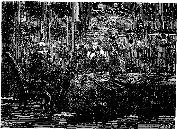
« ΣΚΕΦΘΗΤΕ ΚΑΙ ΑΠΟΦΑΣΙΣΑΤΕ » (Σελ. 181)

ποδίσῃ. Εἰξεύρω ὅτι ὁ Στέφανος διά νά μή σας πικράνῃ, σὲς ὑπεσχέθη ὅτι θὰ κάμῃ τῆν γνώμη σας ἄλλ' ὅμως ἡ θυσία αὐτῆ τῆν ὅποιαν ἔκαμε διά νά σας εὐχαριστήσῃ, τὸν ἀφανίζει, τὸν θανατώνει. Εἶνε δὲ περιττὸν νά σας παραστήσω πόσον εἶνε