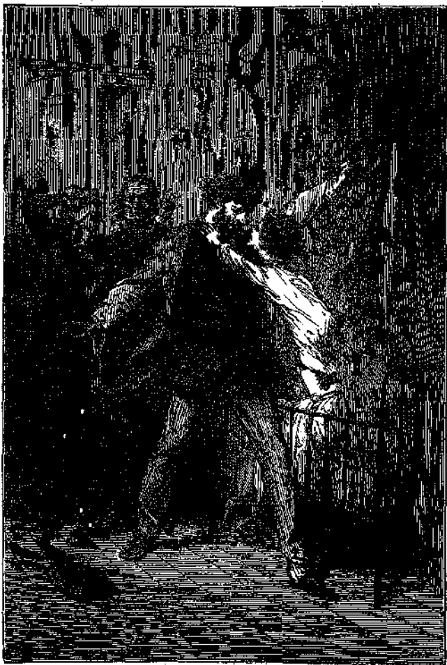
* ΚΑΛΗ ΜΕΡΑ, ΠΑΠΑΚΗ ΜΟΥ! * (Σελ. 163)

» Καὶ εἶπειτα ἐγὼ εἶμαι ἡ αἰτία, ἐγὼ πταίω διότι ὁ Θεὸς τόσα προμηνύματα μου ἔστειλε. Αὐτὴ ἡ θάλασσα τὴν ὁποῖαν τόσο πολὺ ἠγάπα, δὲν εἰξεύρετε πόσον με ἐφρότιζε. Σὰν νὰ μ' ἔλεγε κανεὶς ὅτι το προσεῖλκυε μόνον καὶ μόνον διὰ νὰ μού το καταπῆ. Ἐγὼ ἔπρεπε νὰ ἔχω τὸν νοῦν μου καὶ στιγμὴν νὰ μὴ το ἀφίσω ἀπὸ τὸ πλευρόν μου, καὶ ὁμως ἀπεκοιμήθην ὡς βλάξ!»