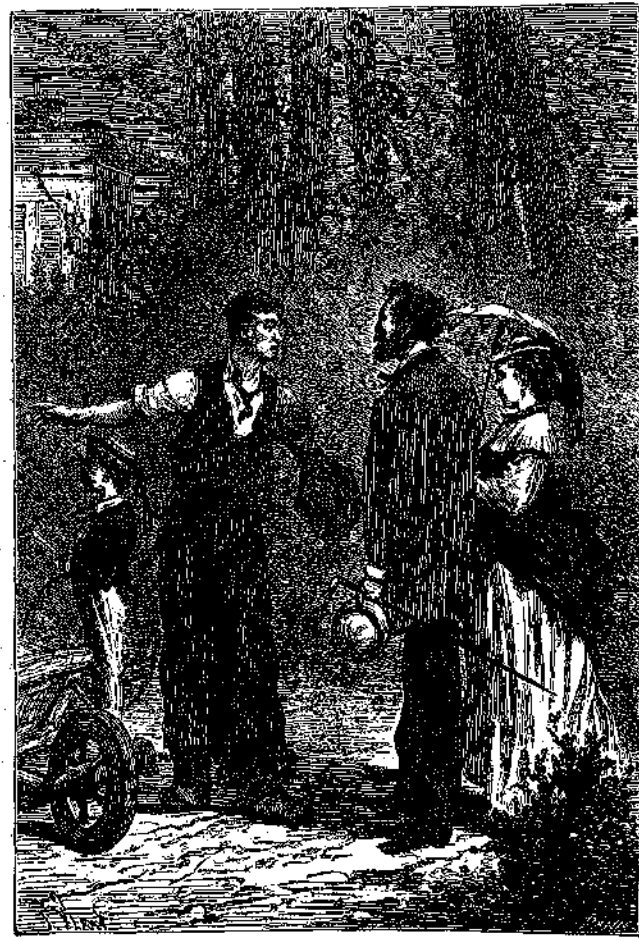
« ΟΡΙΣΤΕ, ΚΥΡΙΑ, ΟΡΙΣΤΕ ΕΛΕΥΘΕΡΑ »

Ἡ κυρία Εἰρήνη ἐδάταξε νὰ εἰσελθῇ. «Ὅριστε, κυρία, ὄριστε ἐλεύθερα. — Αἰ, ἔξ ἐμῶν μεν λοιπὸν, εἶπεν ὁ κύριος Γεώρ-γιος εὐθυμὸς καὶ φαιδρός. Ἄς περάσωμεν ὀλίγας ὄρας ἐδῶ, μετὰ τὴν ἰδέαν πως εἶνε ἰδικόνμας τὸ κτήμα.