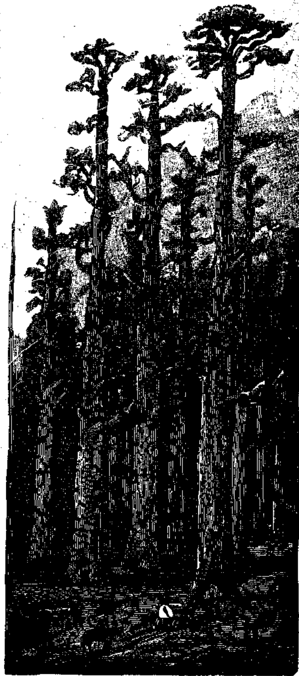
νεῖα τῆς Καλιφορνίας καὶ τὰς Εὐκαλύπτους τῆς Αὐστραλίας, τοὺς ἀληθεῖς γίγαντας τῆς δημιουργίας! ΦΙΑΒΗΤΗΜΟΝ

Ἄλλὰ πόσον πυγμαῖοι εἶνε οἱ γίγαντες οὗτοι τῆς Εὐρώπης σχετικῶς πρὸς τὰ Βελιγκτό-