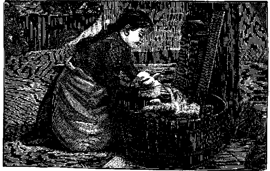
ΚΑΘΕΤΑΙ ΗΕΥΧΑ ΗΕΥΧΑ ΚΑΙ ΤΟ ΠΑΥΝΕΙ Η ΚΥΡΙΑ ΤΟΥ (ἴδε σελ. 6)

Ἐκ τοῦ τυπογραφείου τῶν καταστημάτων ΑΝΕΣΤΗ ΚΩΝΣΤΑΝΤΙΝΙΔΟΥ 1893 — 3333.