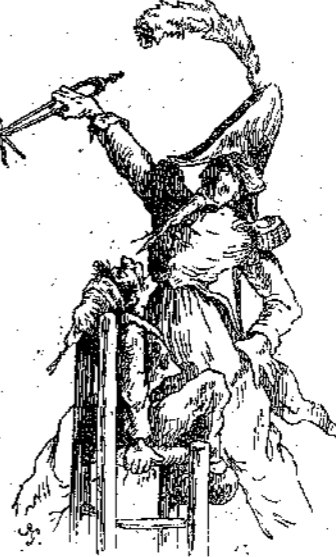
Τοῦ ἔβγαλε καί τι φαβέρς δοντάρς !.. (Σελ. 293, στῆλ. α'.)

γάλη των ταραχῶν ἄλλ' ἦτο ἀδύνατον νὰ κάμουν βῆμα, καθὼς ἦσαν δεμένοι.