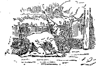
«Με τὸ κερὶ ἔστὸ χερί μελετῶντες τὰ ἦθη τοῦ περιέργου αὐτοῦ ζώου.» (Σελ. 292, στῆλ. β'.)

ρίνα καὶ ἡ Παρέλα, ἀνέλαβον νὰ παρασχολήσουν τὴν κοινὴν προσοχὴν κατὰ τὸρπον περιεργότατον. Μὴ ἔχουσαι πλέον τὰ ἀπαραίτητα ἐφόδια τῆς σχολοβασίας, τῶν ὁποίων δὲν ἐφείσθη ἡ σκληρὰ ἐκείνη πυρκαϊά, ἐτοπεθετήθησαν ἢ μία ὀπισθεν τῆς ἄλλης, εἰς τρόπον ὥστε ἀπὸ τὴν αἰθουσαν δὲν ἐφαίνετο παρὰ μία μόνη. Ἡ πρώτη τότε ἤρχισε νὰ ψάλλῃ μίαν ρεμβοδίαν τοῦ συρροῦ με φωνὴν βραγχὴν καὶ παρατόνον, ἐν ᾧ ἡ δευτέρα περάσασα τὰς χεῖρας διὰ τῶν μασχαλῶν τῆς ἀελέφης τῆς, ἡ ὁποία εἶχε σταυρώσῃ ὀπίσω τὰς ἰδικὰς τῆς διὰ νὰ μὴ φαίνεται, συνάδευε τὸ ἔσμα με τραγικὰς καὶ παραφύρους χεῖρνονίας.