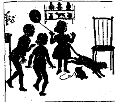
«Τρέχει εις όλον τό δωμάτιον σαν τρελή.»

— Μπα! για κότταξε εκεί πώς κάθεται ή 'Αραπίτσα! Φαίνεται πώς της άρέσουν πολύ τά λουλούδια... Ριά νά ίδούμε όμως, της άρέσουν και τά παιγνίδια; — λέγει ό Γιάγκος, ό μεγαλή-