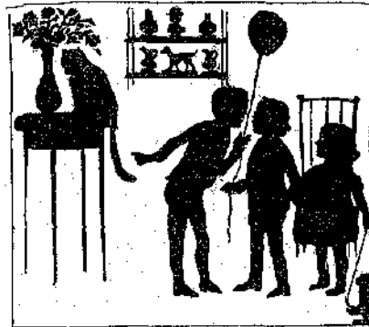
«Κόταξε εκεί πώς κάθεται ή 'Αραπίτσα!»

— Όχι! καλλίτερα νά παίξετε μέσα εις τον κήπον είναι ύγρασία!