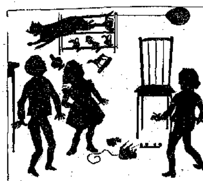
«Και ένώ τρέχει, παρασύρει τά πάντα.»

λια έχομε νά κάμωμε, λέγει ό Νίκος. Άλλά ή 'Αραπίτσα δέν το νοστιμεύεται καθόλου αυτό τό παιγνίδι! κυττάξετε!