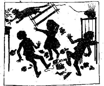
«Συγχρόνως κόπτεται και ή κλωστή.»

δέν ήμπορεί νά έξέλθη. Και ένώ τρέχει, παρασύρει τά πάντα, τραπέζια, έταζέρες, όλα τά ελαφρά έπιπλα της σάλας, με τά κομποτεγγήματα που έχομε επάνω.