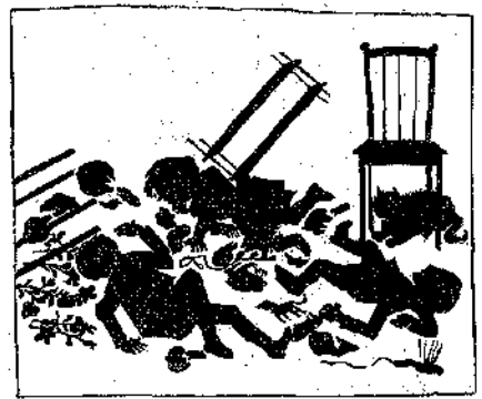
«Έβρε καταφύγιον κάτω από μίαν καρέκλαν.»

Και νά, μία έταζέρα όλόκληρη μ' ένα σωρό πράγματα, πέπτει και κτυπά την Φιφήν εις τό κεφάλι με τόσην δύναμιν, που την ρίπτει κάτω την καιμένην! Συγχρόνως τό μπαλόνι, πιάνεται εις μίαν καρέκλαν, ζουλιέται, και πάφ! σπάζει με κρότον δυνατόν. Συγχρόνως κόπτεται και ή κλωστή. Μπούμ! μπούμ! πα-