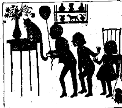
«Δένει την κλωστήν εις την ούραν της 'Αραπίτσας.»

— Παίξωμε τό κυνηγητό; Τι λέτε; — Όχι! θά κάμωμεν τό σπίτι άνωκάτω.