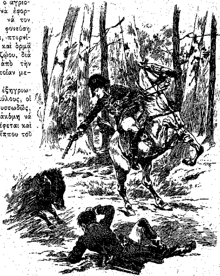
« Ἀρπάζει ἐν πιστόλιον, σκοπεύει καὶ πυροβολεῖ. » (Σελ. 297, σσ. 6'.)

τωρ, ὁ ὁποῖος εἶχε διατήρησιν ὄλην του τὴν ἀταραξίαν. Βλέπω ὅτι δὲν ὠφελήθησεν πολὺ ἀπὸ τὰ μαθήματα τῆς ἵππασίας. Ἔτσι πίπτουν οἱ ἄνθρωποι ἀπὸ τὸ ἄλογον μετὰ τὸ πρῶτόν του τίναγμα; Ἴθι θὰ ἔκαμνεν τότε εἰς καμμίαν ἔφοδον ἵππου;