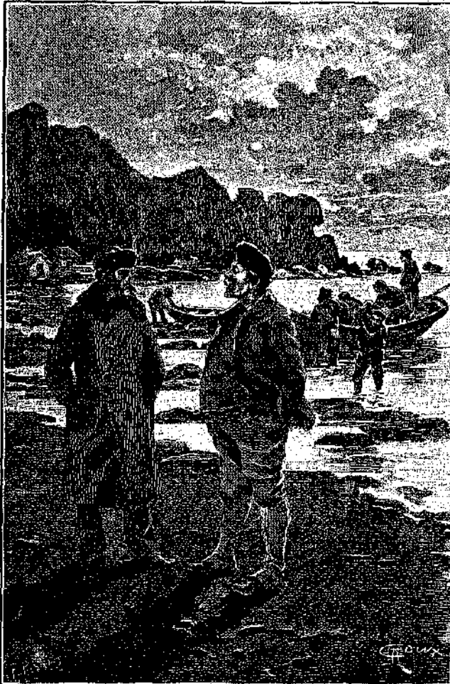
Ἐκεῖ συνωμλήσαμεν φιλικώτατα περὶ πολλῶν καὶ διαφόρων... (Σελ. 105, στήλ. α')

— Μίαν ἀγγλικὴν γολέτταν, ἡ ὄποια ἐστάθμευσεν εἰς