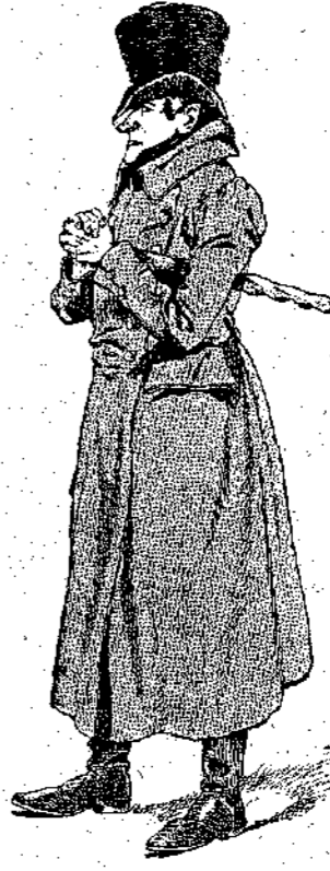
Ὁ κύριος Μπρόου

Εἰς τοιαύτας περιστάσεις, πρῶτος συνήθως ἐλάμβανε τὸν λόγον ὁ εὐγλωττος Παπαρίγκος. — Πρέπει νὰ ἦταν ὁ διάβολος ! εἶπε μὲ σοβαρότητα ὁ πεζοναύτης ἀπὸ τὴν πόρτα βέβαια οὔτε ἐμβῆκε, οὔτε ἐβγήκε, γιὰτί ἀλλοιῶτικα θὰ μ' ἐξυπνοῦσεν. Ἄλλὰ καὶ ὁ διάβολος νὰ εἶνε, ἂν πέσῃ ἔστὰ χέρια μου, θὰ τον τσακίσω. Αὐτὴ εἶνε ἡ γνώμη μου.