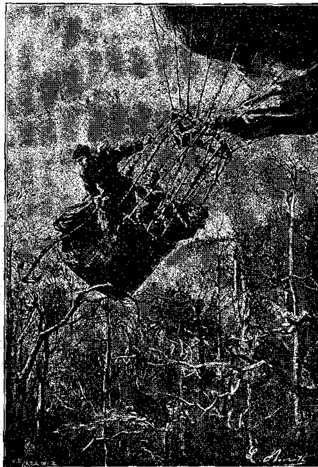
α Τὸ ἀρβαντατὸν προσήγγιζεν ἕξ τὴν κορυφὴν τῶν δένδρων.

Τὸ «ΥΠΕΡ ΠΑΤΡΙΔΟΣ» τιμᾶται ἀδεύον μὲν φρ. 3,80, χρυσόδετον δὲ φρ. 5. Διὰ τὸ Ἑξωτερικὸν ἡ αὐτὴ τιμὴ εἰς χρυσόν. Πᾶσα παραγγελία, γινομένη ἀπ' εὐθείας διὰ συστημένης ἐπιστολῆς: Πρὸς τὸν κ. Ν. Π. Παπαδόπουλον, ἐκδότην, ὁδὸς Αἰόλου 117, εἰς Ἀθήνας, πρέπει νὰ συνοδεύεται ἀπαραίτητως ὑπὸ τοῦ ἀντιτίμου.