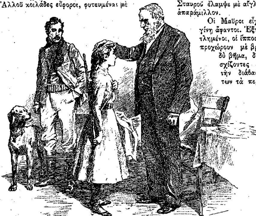
«Ο Θεός να σε φυλάττη, παιδί μου, είπεν ο Κροῦγερ.» (Σελίς 117, στήλη γ'.)

ζαχαροκάλαμον' άλλου λοφίσκοι γραφικοί και καταπράσινοι' άλλου σύσκια άλη φοινίκων, κάκτων γιγαντιαίων και βανανέων.