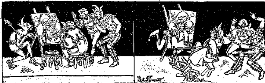
Ο ΖΩΓΡΑΦΟΣ ΚΑΙ Ο ΓΕΛΩΤΟΠΟΙΟΣ