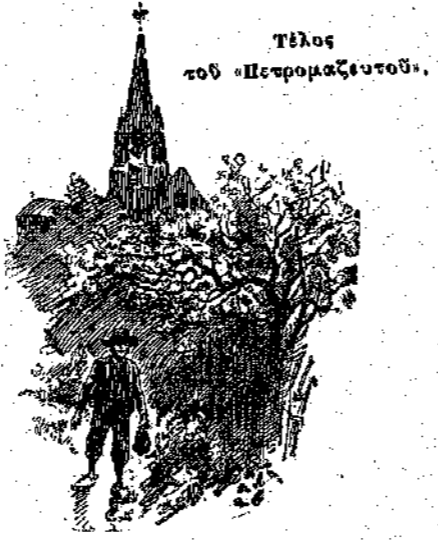
Τέλος τοῦ «Πητρομαζευτοῦ».