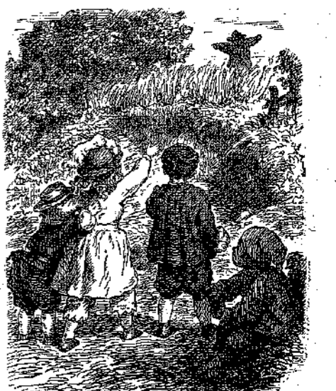
« Ένα γίγαντα, ένα δράκον ἴσως.»

Ένῶ τραβοῦν τόν δρόμον των διά νά εὔρυν τήν άγελάδα, τά παιδάκια βλέπουν έμπρός των, μέσα εἰς ένα χωράφι μέ σιτάρι, ένα γίγαντα, ένα δράκον ἴσω, μέ τὰ χέρια του άνοικτά διά ν' άρπάξῃ ἴσως, κάτι τί που δέν το βλέπουν. Εὐτυχῶς ὁ γίγαντας ε-