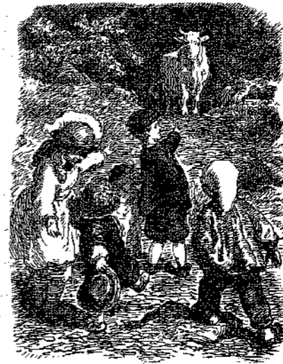
« Μία ὄρατα άσπρη άγελάδα.»

— Και χωρίς μουστάρδα, προσθέτει ὁ πλοίαρχος.