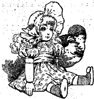
Μία μικρούλα κουκλίτσα...

Ὁ Σπουργιτάκης τὸ ἀκούει, καὶ... πετᾷ κυριολεκτικῶς ἀπὸ τὴν χαρὰ του.