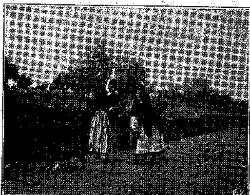
ΑΠΟ ΤΗ ΒΡΥΞΗ

Ὁ Νίκος Κατερινόπουλος ἔχει νὰ ἐπιδείξῃ τὴν Πύλιν τοῦ Ἀδριανοῦ, ὑπὸ ὠραίαν ἀποψιν καὶ με καλὸν χρωματι- σμὸν. Αἱ ἄλλαι δύο φωτογραφίαι του (τὸ Σ αἶθρον καὶ ὁ Ἐξοχικός περπα-