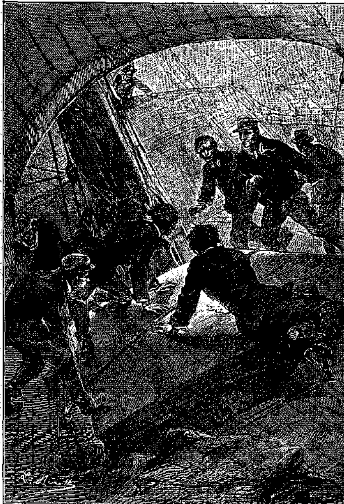
*Ἐσπευσεν αἰτίσιμα ὁ Οὐίλ Μιτζ. (Σελ. 354, στήλ. γ.)