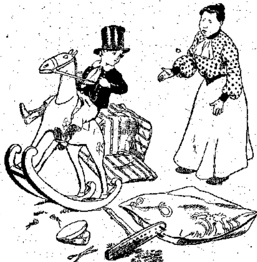
• Έλα λοιπόν να κοιμηθής! •

Χάνει τήν ύπομονή της ή μαμμιά του, και τον άφίνει να κόμη ό, τι θέλει. Και είνε δίκη ή ώρα, όταν ό φιλαράκος μας, κουρασμένος και νυσταγμένος, άποφασίζει να πέση να κοιμηθώ.