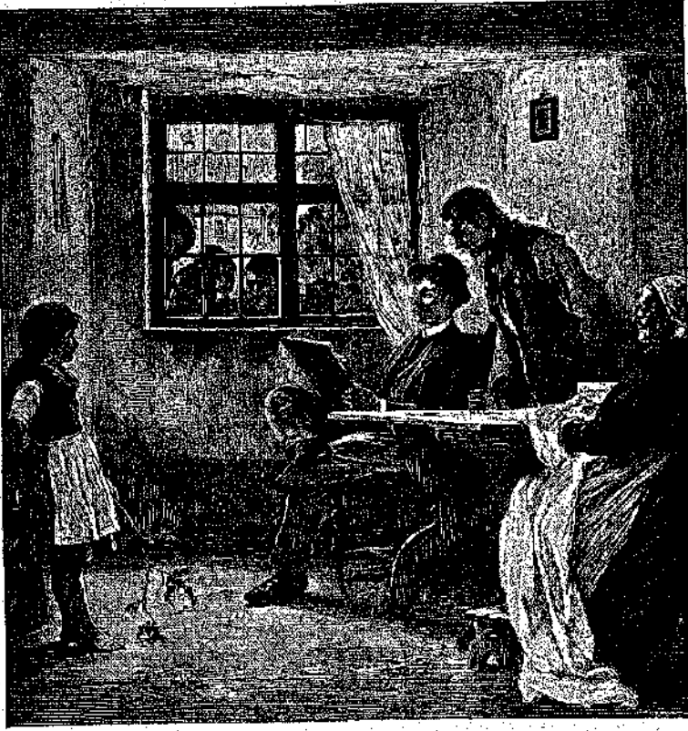
• Η Μαρία στέκεται όρθη εμπρός εις τόν ζωγράφον. (Σελ. 357.)

Ο ζωγράφος όμως κρατεί ένα μεγάλο ρύλλο άσπρο χοντρώ χαρτί επάνω σ' ένα μεγάλο βιβλίον, μεγαλείτερο και από τ' ες βιβλίον τού ψάλτη της εκκλησίας, και δός του μ' ένα μολύβι, τραβά