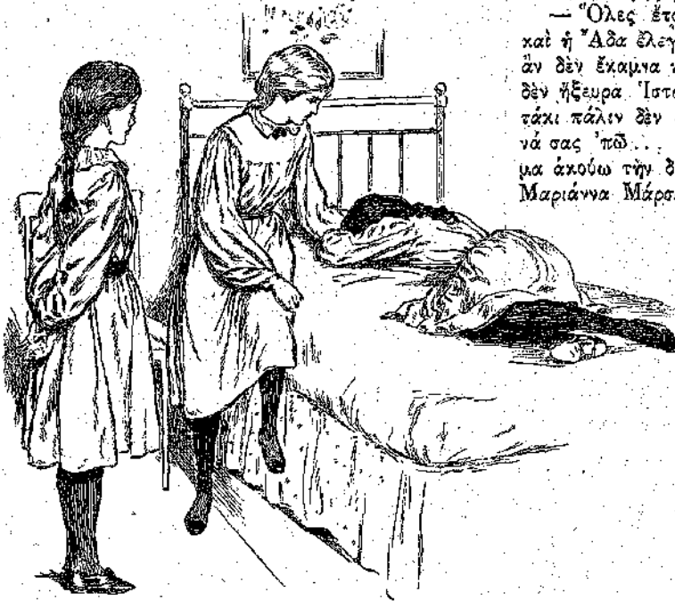
Ἡ Δωροθέα ἐκάθησε πλησίον της. (Σελ. 169, στήλ. γ')

Καὶ ἡ Μαίρη, ἡ ὁποία πάντοτε ἦτο εὐπειθὴς εἰς τὰς διαταγὰς τῶν διδασκαλισσῶν της, εὐτακτος καὶ ἐπιμελεστάτη, ἐκάθησε κοντὰ εἰς τὴν συμμαθήτριά της, καὶ μετὰ τὴν ἐπιτηδεύθητά την κατεπαύετο καὶ τὴν ἡσύχασεν, ὥστε ἡ Μαριάννα σιγά-σιγά ἐπέσειν εἰς ὕπνον βα-