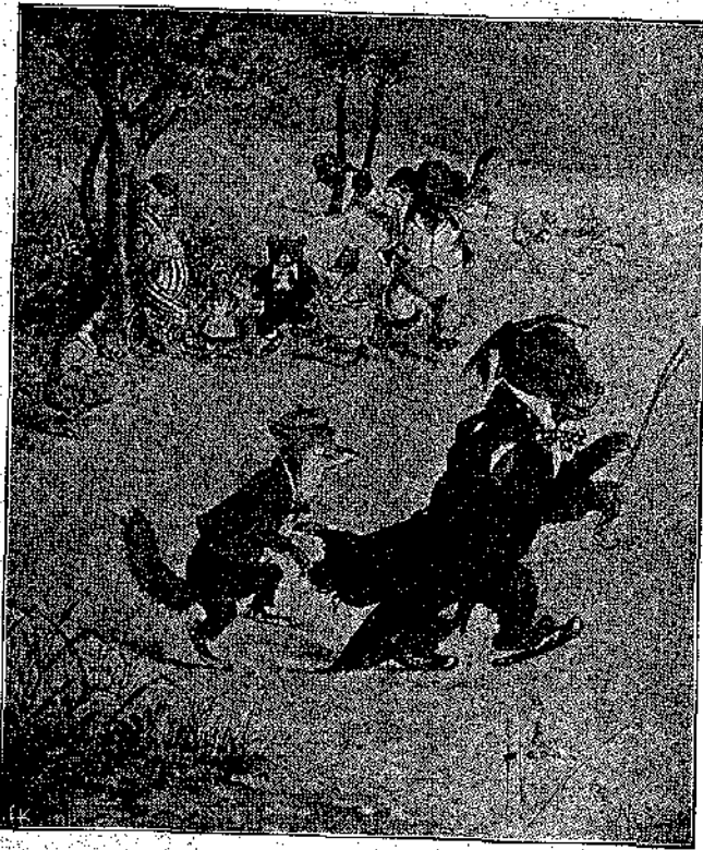
«Ὡ! τί παιχνίδια ποῦ ἐπαιζαν!»

Ἐκατέβασαν τοὺς πίνακας, ποῦ εἶχαν τυπωμένα μετὰ μεγάλα ψηφία, ὁ ἕνας τὸ γαλλικὸν ἀλφάβητον καὶ ὁ ἄλλος τοὺς ἀριθμοὺς ἀπὸ τὸ 1 ἕως τὸ 20, κ' ἔδωσαν μιὰ μετὰ τῆς κοῦτρῆς των καὶ τὰ ἐτρόπησαν, (αἱ ἀρκουδοῦς, ζῆρετε, ἔχουσι κοῦτρῆς, πολὺ κοχλῆδες, σὰν κοῦτσουρα), καὶ ὑστέρᾳ ἐπῆραν δρόμον, με-