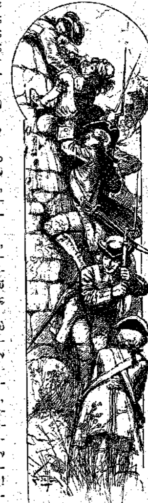
“Αυτός έφθασε πρώτος εις την κορυφήν του τείχους. (Σελ. 349, στήλ. γ.)

Νά τον τώρα εμπρός εις τὸ ρεῦμα του Έσκό! Νά ή πλωτή γέφυρα, όπου