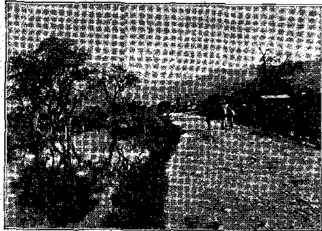
ΠΑΡΑ ΤΗΝ ΟΧΘΗΝ

— Μόδες μας τὰ ἐκάμαμε ! εἶπαν. Οἱ μικροὶ ἠθοποιοὶ μας ἔδωσαν, τὴν μεθεπομένην ἑσπέραν, τὴν δευτέραν των