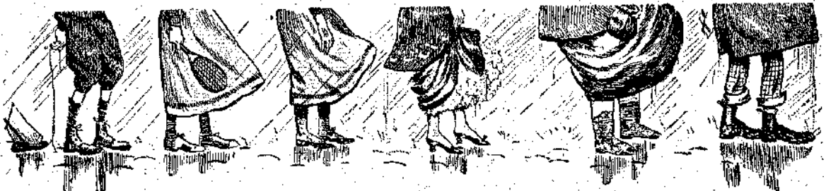
« Ἡ βροχὴ ἔπεσε ποτάμι. » (Σελ. 362, στήλ. α')

τὰ τὰ φαινόμενα. — ἐπλησίασε πρὸς τὸ ἀνάβαθρον τοῦ τράμ.