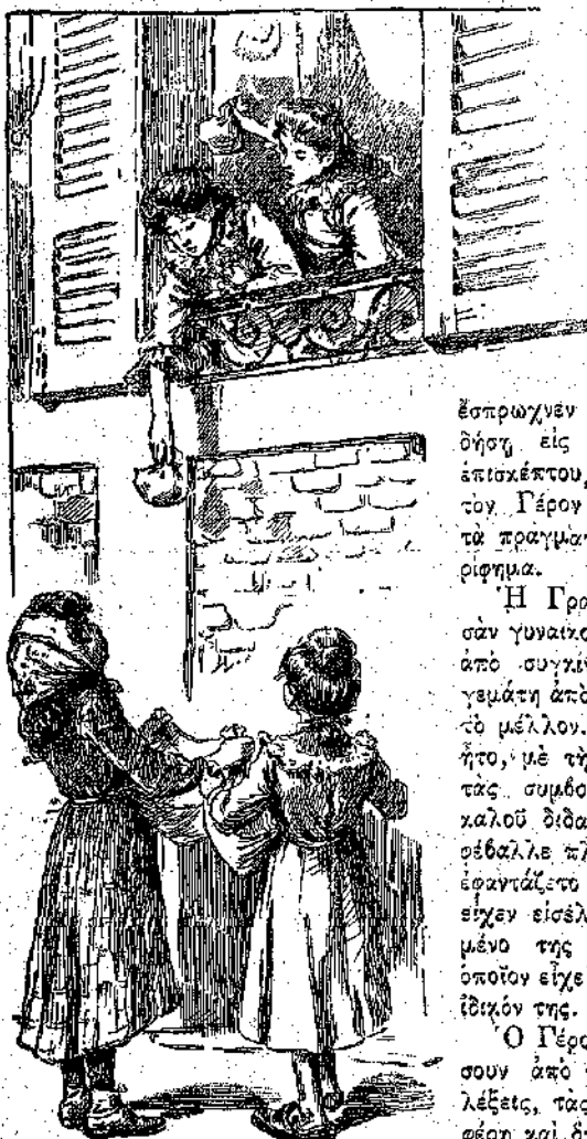
«Κάθε μία έρριψε το δεματάκι της...» (Σελ. 388, στ. γ')

— Έννοώ. Δι' αυτό θα μένετε και εκεί εις το τροχόσπιτό σας. Η συγχαράς, θα εύρω... ξεύρω εγώ πόσον... και θα τον παρακαλέσω να σας άφιση να μένετε εις τα έξωτερικά βουλεβάρτα, ή εις καμμίαν απόκεντρον γωνίαν, όπου δεν θα ένογλήτε κανένα και κανεις δεν θα σας ένοχλή. Εκεί, θα ήμπορητε να τρώτε, να κοιμάσθε, να έργάζεσθε, να κάμνετε πρόβες, όπως εις την έξοχην. Το βράδυ, το άλογο σας θα σας πηραίνη εις το θέατρον και θα σας ξαναφέρη πίσω. Και, άρκει να μη λέντε πως και τί εις κανένα, άρκει ή Ρίτα να έχη καὶ κοντή την γλώσσάν της και να μη δώσῃ την διεύθυνσιν της κατοικίας της εις τους άδιακρίτους... βεβαίως δεν θα έλθῃ ὁ διευθυντής του θεάτρου σας, ὁ οποῖος γνωρίζει τώρα, από εδώ, όλα τα καθέσαστα, να σας άνησυχήσῃ.