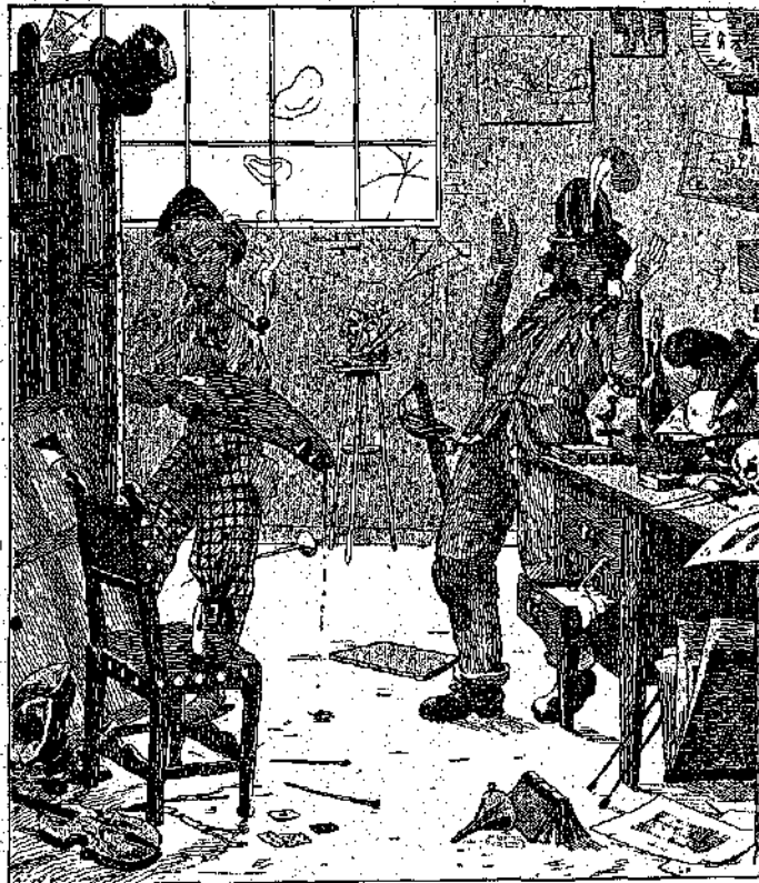
«Νὰ κράτῃ τὰ χέρια του ὑψηλά...» (Σελ. 378, στήλ. α')

Τέσσαρα πορτοφῶλια, διαφόρων βαθμῶν παιλοτήτης καὶ λίγδας, ἀπεσφύθησαν ἀμέσως ἀπὸ τὰς τσέπας, τὰς παράγεμισμένους με διάφορα σύνεργα καὶ ἀντικείμενα, καὶ οἱ τέσσαρες φίλοι ἐνήργησαν τὴν κατχρη-