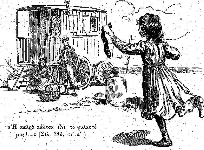
«Η καλή κάλτσα εινε τὸ φυλαχτό μας!...» (Σελ. 389, στ. α')