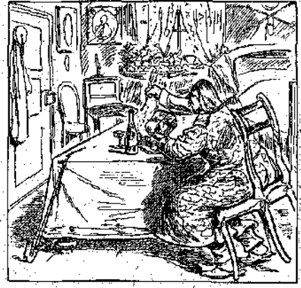
— Ἐμπρός!... Ποῖος κτοπᾷ;

(Ἦσαν αἱ ἀνωτέρω Ἀσκήσεις, ἐκτὸς τῆς Μ. Εἰκότος, ἐληφθῆσαν ἐκ τῆς βραβεύσεως Συλλογῆς ΠΤΟΛΕ-ΜΑΙΟΥ ΤΟΥ ΚΕΡΑΪΝΟΥ.)