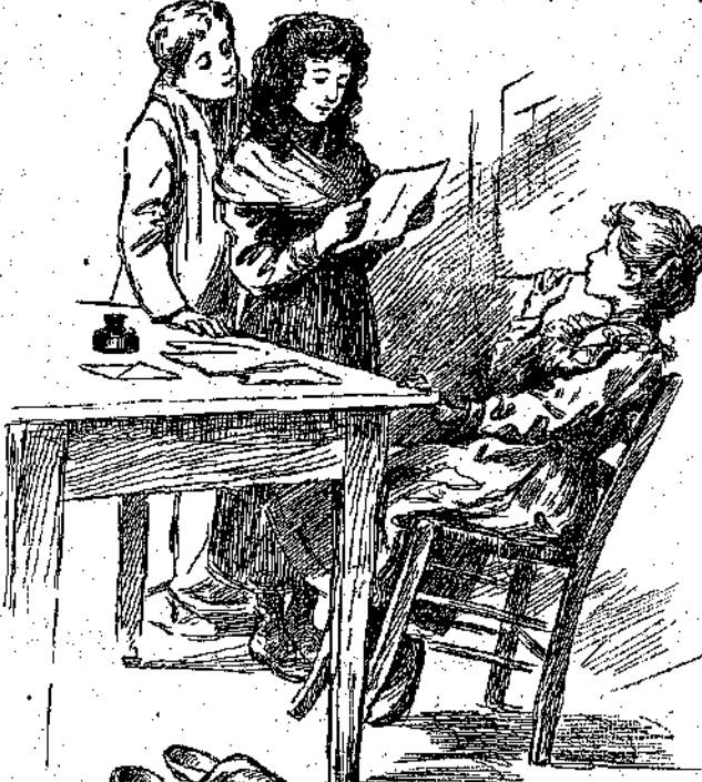
«Δεν είνε καλό; είπεν η μικρούλα...» (Σελ. 410, στ. α')

Η Γρατσιέλλα ήκολούθησε το στάδιον της και έγινε μία από τας μεγάλας καλλιτέχνιδας τῆς σκηνῆς. Καθημερινῶς ο Πετρογιάννης συνάδευε την αδελφήν του εις το σχολεῖον, έπήγαινε επειτα εις το ἴδιόν του, και τὸ βράδυ έπήγαινε και τὴν επαιρνε. Ηλθεν όμως ο καιρὸς, και δεν έφάνησαν πλέον, οὔτε ο ένας οὔτε ο άλλος εις τὸν τακτικὸν τῶν δρόμον του σχολείου.