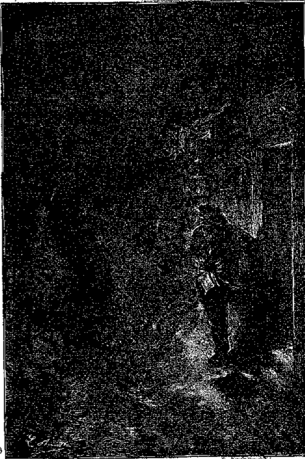
«Ἐξηφανίσθη εἰς τὸ νύκτιον σκότος...» (Σελ. 93, στ. α')

θυλακίου του ἐν σημειωματάριον, ἔγραψεν ἐπ' αὐτοῦ ὀλίγας λέξεις, ἀπέσπασε τὸ φύλλον καὶ τὸ ἔδωκεν εἰς τὸν Τράνκελ, λέγων: — Πήγατέν το αὐτὸ καὶ περίμενε νὰ σοῦ δώσουν ἀπάντησι! Ὁ Τράνκελ ἐγνώριζε καλὰ διὰ ποῦ ἦτο ἐκεῖνο τὸ γράμμα καὶ τί εἶδους ἀπάντησιν ὄφειλε νὰ περιμένῃ... Δὲν ἐπρόφερον ὅμως λέξιν, ὑπεκλίθη, ἤσπασθη τὴν χεῖρα τοῦ κυρίου του, καὶ ἐξῆλθε διὰ νὰ μεταβῇ εἰς τὴν Ἀστυνομίαν. Τὸ σημεῖωμα περιεῖχε μόνον αὐτὰς τὰς λέξεις: