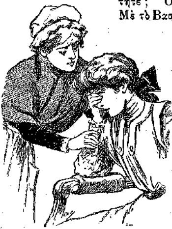
«Μὴ μοῦ κλαῖς, χρυσὴ μου Ἑλενίτσα...» (Σελ. 90, στ. α')

σοὶ ὁ Θεός ! Ἐλα λοιπόν, γελᾶστε !... Ἔτσι γιὰ !... Εἶσθε χίλιες φορές πῶς ἄμορφη ὅταν γελᾶτε... Γιατί εὐμορφή εἶσθε ! Ἄ, ἔλος ὁ κόσμος τὸ λέγει, καὶ σεῖς ἡ ἴδια τὸ ξέρετε καλά... ἔ, κοκκέτα μου ;