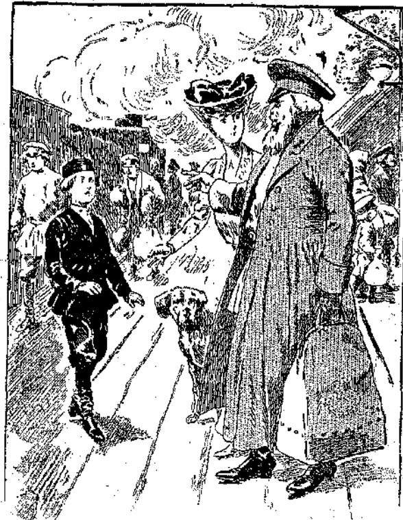
«Ο Σάσας όπισθοχώρησε...» (Σελ. 20, στ. β')