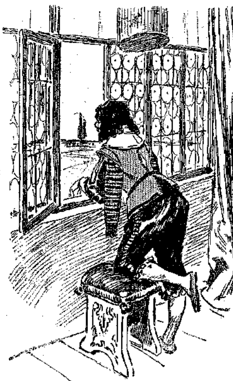
Ὁ Λούλλης ἐπληττε θανασίμως... (Σ. 348.)