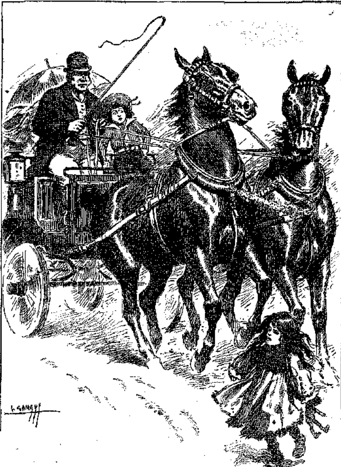
«Ἀμέσως ἐκράτησε τοὺς ἵππους...» (Σελ. 339, στ. α')

— Τί νὰ εἶνε αὐτὸς ὁ «Γάτος»; ἐψιθύρισεν ἡ γραῖα. Ἄ! Ὅα εἶνε ἡ τα-