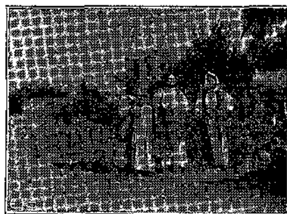
ΕΠΙΣΤΡΟΦΗ ΕΚ ΤΟΥ ΒΟΥΝΟΥ

Ναυτοίκας τῆς Θυέλης. — Δεύτερον Βραβείον