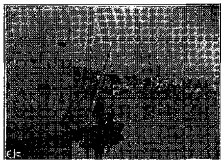
ΑΡΑΞΕΙ Η ΒΑΡΧΟΛΙΑ

[Συνέχεια: ἴδε προηγούμενον φύλλον, σελ. 342.]