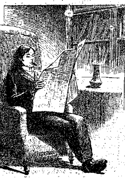
Ἐβουλίετο εἰς τὴν ἀνάγνωσιν τῶν ἀμερικανικῶν ἡμερησίων. (Σελ. 230, στ. β'.)

Τὴν νύκτα ἐπὶ τὴν ἀποκομιτὴν ὁ ἰατρός ἐκοιμήθη ἠσυχῶς. Ἀλλ' αὐτὸς ἀπὸ τὴν ἄλλην ἡμέραν ἤρξατο νὰ μέσθῃ ὡς εἶν ὁ κύριός του ἦτο παρών. (Σελ. 229, στ. α'.)