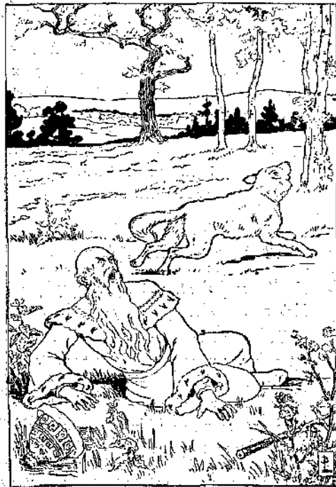
«Τὸν ξεφορτώθηκε καὶ τῶβαλε στὰ πόδια...» (Σελ. 349, στ. γ')

Ὁ Ἰβάν καθάλλικεψε τὸ λύκο κ' ἐξέκριναν ὅλοι γιὰ τὴ χώρα τοῦ Τσάρου Ἀλέξη (*).