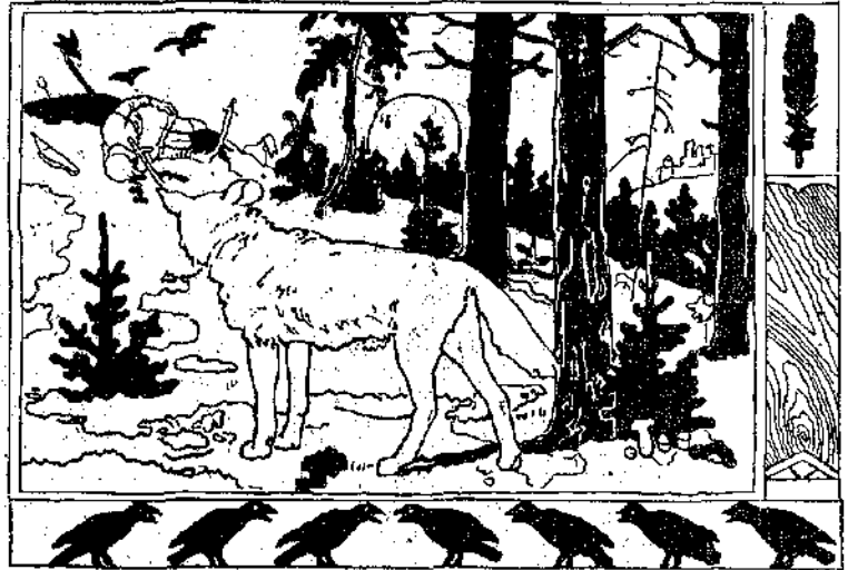
«Ὁ στακτερός λύκος, περστικὸς ἀπὸ ἐκεῖ...» (Σελ. 350, στ. γ')

— Ἀνέβα στὴ ράχι μου, Ἰβάν, καὶ ἡ ὠραία βασιλοπούλα ἔς μείνη στὸ ἄλογο μετὰ τῆ χρυσῆ γαίτη.