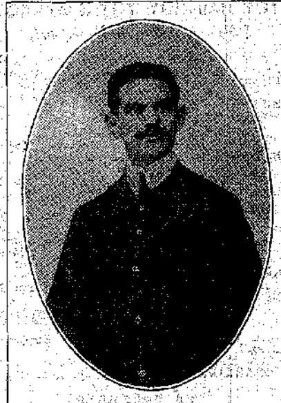
ΑΝΤΩΝΙΟΣ Μ. ΦΑΝΗΣ (έν Πόρτ-Σαίδη) Βραβεύθηκε υπό το ψευδώνυμον Γόρδιος Δεσμός εις τον 117ον Διαγωνισμόν προς σύνθεσιν Πνευματικών Ασκήσεων [17ος Διάπλασιν του 1911, σελ. 235]