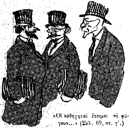
«Οι καθηγηταί έτοιμοι να φύγουν...» (Σελ. 69, στ. γ'.)

— Γιαννάκη, γραμματική! Πότε τά εις ό τ ε ρ ο ς και ό τ α τ ο ς γράφονται με ώμέγα; Ποία είνε ή ρίζα του ε ί μ ι ; Δεν ξέρεϊ πιά λέξι! Άκούε ρίζας, και βλέπει άμπρός του... τας ρίζας τών φυτών, πού έξέσκαπεν εις τό περιβόλι. Αύτός ο Όμηρος όρθούται άνώπιόν του τρομερός και φοβερός, λέγων ότι είνε ένας μεγάλος ποιητής, πού όφείλει να τόν άνοή. Τα ρήματα πιάνονται με τας άντωνυμίας, και μέσα εις τόν καυχόν πετιούνται τρίγωνα, τετράγωνα, κύκλοι, πυραμίδες, παραλληλεπίπεδα, με μικρά γράμματα εις όλας τας γωνίας. Να και τό τετραγώνον τής ύποτεινούσης, τό όποϊον κρατεί ο όγριος καθηγητής τών μαθηματικών. Αύτός τα ξέρεϊ όλα, διότι