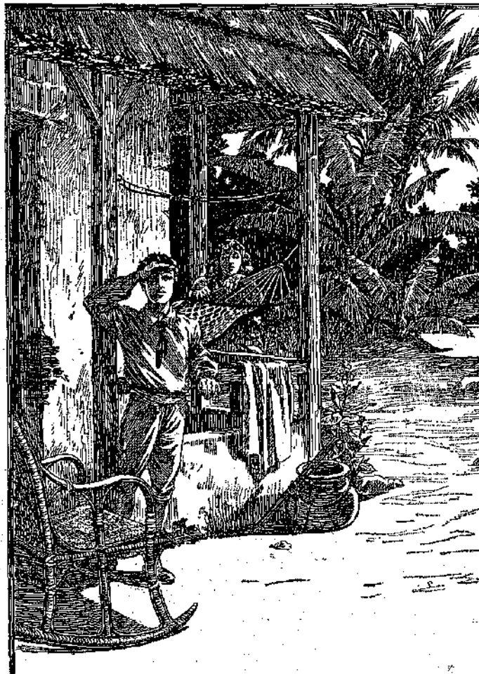
Ἡ Ὁδάλια δὲν ἤρχετο...

Ἄλλ' ἐκείνη δὲν ἀνησυχόουσε διὰ τὰς πληγὰς της. Ἐκύτταξεν ἀτενῶς, μετὰ πόθον, τὸ ἔπλον ποῦ τῆς εἶχεν κάρη. Καὶ διὰ νὰ τὸ ἀνακτήσῃ, εὐχαριστῶς θὰ ἐδέχετο νὰ τῆς πληγώσουν ἔ-