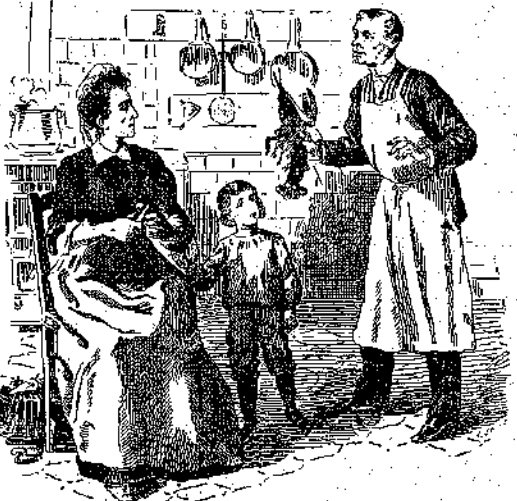
«Καλὰ φωνίζει ὁ Κύρ-Λῶς, ἔ; .. (Σ. 353, στ. α').

«...Ἐπειτα, ἐνώ ἡ κυρία Κορπανώφ ἀπίστωσε τὴν χεῖρά της, διὰ νάριση ἐλευθεροῦ τὸν Αὐγουστο να συνομιλήσῃ με τὸν φίλον του, ὁ Μεράν, ἀφίνων κάτω τὴν βαλίτζαν ποῦ ἐκρατοῦσεν, ἐπεκύρωσε τὴν φράσιν του διὰ θερμότητος χειραφίας και προσέθεσεν :