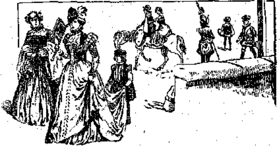
Τὸ ριπίδιον κατὰ τὸν 19ον αἰῶνα.

Ἐπί τῶν ὀπίσμων τῶν κοινῶν ριπίδιων, τὰ πωλούμενα χονδρικῶς, ἐπὶ τῶν ὀπίσμων ἐργάζονται αἱ ἰδιοτροπίαί