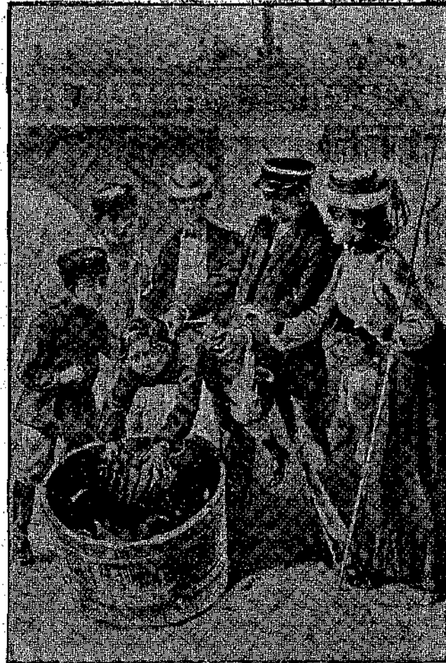
«Ὁ Κύριλλος ἔπεσε μέσα 'ς ἓνα μαστέλλο με πῖσσαν...» (Σ. 361)

— Ἐπειτα, ἐνώ ἡ κυρία Κορπανώφ ἀπίστωσε τὴν χεῖρά της, διὰ νάριση ἐλευθεροῦ τὸν Αὐγουστο να συνομιλήσῃ με τὸν φίλον του, ὁ Μεράν, ἀφίνων κάτω τὴν βαλίτζαν ποῦ ἐκρατοῦσεν, ἐπεκύρωσε τὴν φράσιν του διὰ θερμότητος χειραφίας και προσέθεσεν :