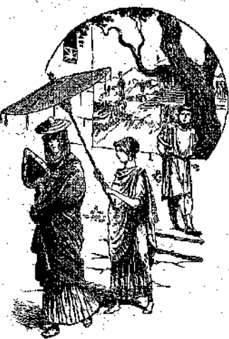
Τὸ ριπίδιον εἰς τὴν ἀρχαίαν Ἑλλάδα.

Θά σάς ευχαριστούσεν, αγαπηταί μου νεαραί αναγνώστριαι, αν έμανθάνετε πώς κατασκευάζεται τὸ κομψόν έκείνο παράρτημα τῆς γυναικείας ένδυμασίας, τὸ ἔκδοτον ονομάζεται ριπίδιον ἢ κοινῶς βεντάγια , καὶ ἀπὸ πόσας ἐργατικὰς χεῖρας περνᾷ καθέν τῶν μερῶν του, προτοῦ συνενωθῶν ὅλα διὰ νὰ σχηματίσῃ ἐν ἄραθον, κάποτε πολυτελεῖς καὶ κάποτε λεπτεπίλεπτον κομφοτέχνημα; Διὰ νὰ ἐπιληθώμεν τεχνικῶς, ἡ βεντάγια ἀποτελεῖται ἀπὸ δύο διακεκριμένα μέρη: τὴν σκελετὸν καὶ τὸ ένδυμα ἢ φύλλον . Εἰς τὰ ἐργαστάσια, ὁ σκελετὸς ονομάζεται καὶ πῶδι ἢ ξύλο , ἀπὸ οἰανδῆποτε ἄλλως τε ὕλην καὶ ἂν εἴνε καμωμένως.