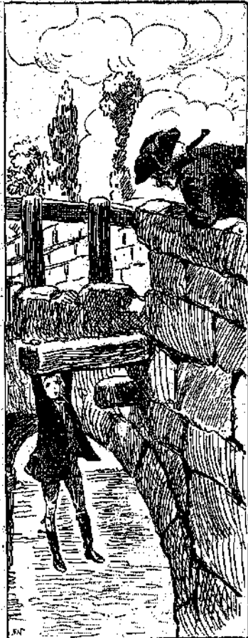
«Βοήθεια!..» (Σελ. 77, στ. 6)

— Συνταγματάρχα μου, εἶνε ἰσως κατὰρὸς νὰ διατάξῃτε νὰ ἱππεύσουν, ἀν- ἐπιθυμητὰ νὰ κοιμηθῇ ἀπόψε τὸ σύν- ταγμα σας εἰς τὸ Κλαίριον, ἔπου μᾶς περιμένουν τὰ καταλύματα.