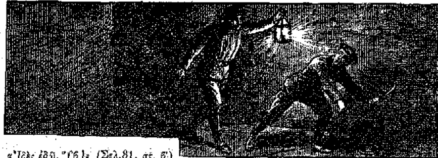
"Υ6, εδω, "Υ61" (Σελ. 81, στ. 6)

Ο πρώτος πύργος των Κερωδρέν ήτο, ως είπαμεν, κτισμένος επί μικρής νησίδος, άκαλλιεργήτου κ' έρήμου. Ητο