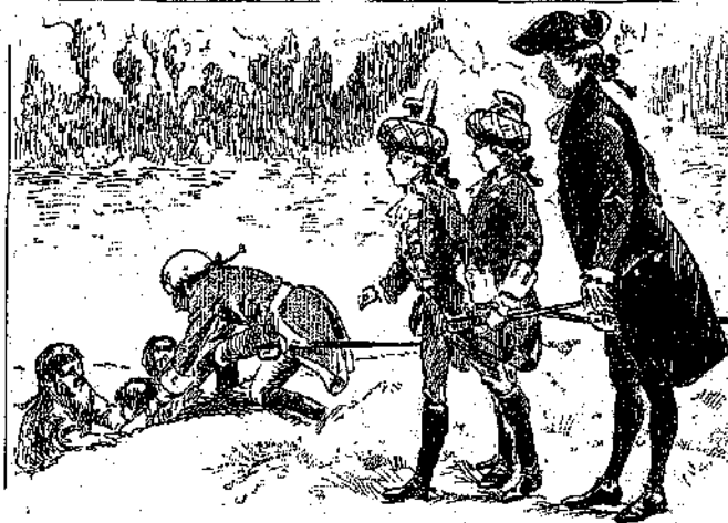
«Μετ' ὀλίγας στιγμῆς ἐφθάσαν εἰς τὴν ὄχθην...» (Σελ. 78, στ. γ')

ἐνθύμως τὸν ἄθλον αὐτὸν τοῦ αρχηγοῦ των. Ἐλαῖνος, ἐνθαρρυνθεὶς ἀπὸ τὴν ἐπι- τυχίαν, ἠτοίμασθ' νὰ ἐξακολουθήσῃ τὸ ἀγαπημένον του παιγνίδι ὅταν ἔξαρνα, μὲ τὸ χεῖρ σηκωμένον, ἐστομάχησε καὶ ἔδειξε μὲ τὸ ἄκρον τοῦ δακτύλου ἓνα μικρὸν μαδρὸν σημάδι, τὸ ὁποῖον ἐκατα- βαζε τὸ ρεῦμα τοῦ ποταμοῦ.