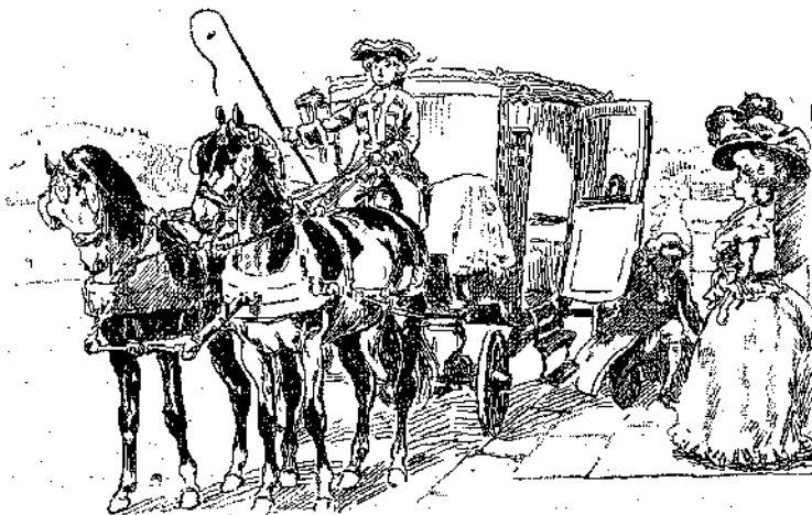
«Ὁ δοῦξ ἐγονάτισεν ἐνώπιον τῆς Βασιλισσῆς...» (Σελ. 182 στ. α').

Τὴν στιγμὴν πῶς ἠτοιμάζετο νὰ ἐπιβῇ, ὁ δοῦξ σπρώξας τὸν ὑπηρέτην, ὁ ὁποῖος ἔτρεχε νανούξῃ τὴν θυρίδα, ὤρμησε καὶ