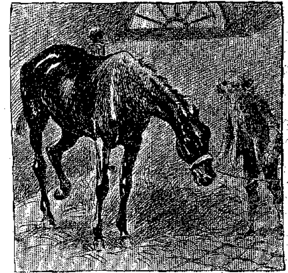
«Ὡ, πόσον εἶχε μεταβληθῆ!...» (Σελ. 182 στ. γ').

Κατευχαριστημένος ὁ Μπόμπης πῶς ἐπέτυχεν εἰς τὰς διαπραγματεύσεις του,