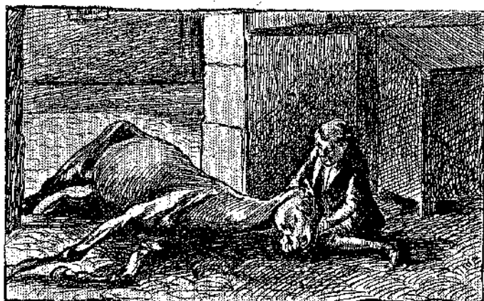
Ὁ Μπόμπης ἔμεινεν ἐκεῖ, συντετριμμένος ἀπὸ τὴν λύπην...» (Σ. 189, στ. γ')

Μὲ αὐτὰς τὰς θλιβερὰς σχέσεις, ἡ ἡμέρα εὖρε τὸν Μπόμπην ἄγρυπνον.