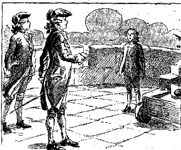
«Τί κάνεις ἐδῶ, μικρέ;» (Σελ. 270 στ. β')

χρίτως καὶ νὰ τρέχουν κατ' εὐθείαν γραμμὴν, ἀμιλλώμενα ποῖον νὰ πρωτοφθάσῃ εἰς τὸ ἄκρον τοῦ διαδρόμου, ὅπου ἦτο κρεμασμένον τὸ ἑσθλὸν τῆς ταχυτήτος.