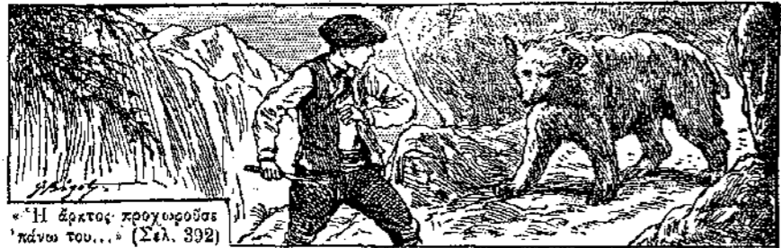
« Η άρκτος προχωρούσε πάνω του... » (Σελ. 392)