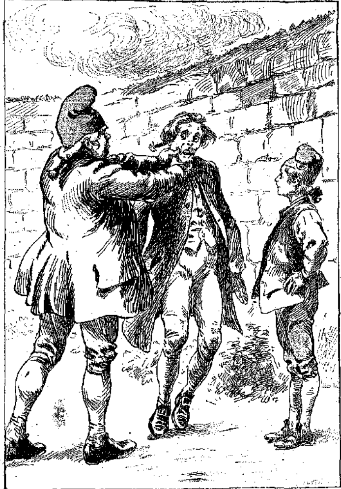
«Ταῦτα λέγων ὁ Ἡρακλῆς, ἐσφιγγε τὸν λαιμὸν τοῦ ὑπηρετοῦ τόσον δυνατὰ...» (Σελ. 391 στ. α')

εἶνε γεμάτος κρύπτας, μυστικὰς κλίμακας καὶ ἀφανεῖς θύρας. Διότι αὐτὸς ὁ πανούργος δὲν φθάνει ποῦ μὲ κρατοῦσε φυλακισμένον, διὰ νὰ νέμεται τὴν περιουσίαν μου, ἀλλὰ φαίνεται ὅτι κάρνει καὶ ἄλλες βρωμοδουλειᾶς, ποῦ ἀπαιτοῦν τέτοιαις προφυλάξεις. Ἐχει πολλοὺς βοηθούς, οἱ ὅποιοι μαθεύονται ἐδῶ κρυφὰ, ἀπὸ τὰ ὑπόγεια καὶ τοὺς μυστικοὺς διαδρόμους, ποῦ βγαίνουν εἰς τὸ βουνὸν ἢ εἰς