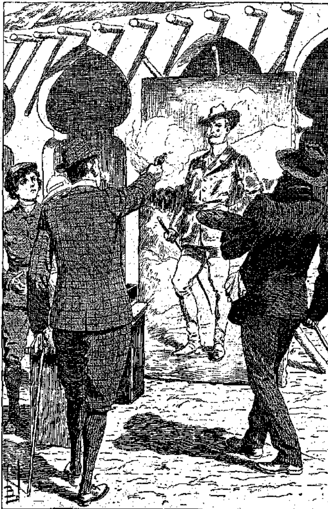
«Ἐσκόπευε τὴν εἰκόνα κ' ἐκυροβάλλεσε τράς...» (σελ.190,στ. γ')

«Ὀνομάζομαι Σερ Ροδόλφος Τσουάν. Τὸ ὄνομα αὐτὸ δὲν σᾶς λέγει τίποτε, παιδιά μου, διότι εἶσθε μικροὶ ἀκόμη, εἶνε ὅμως τὸ ὄνομα ἐνός διασημοῦ ζωγράφου τῆς Ἀγγλίας. Πρὸ ἑξ μῆ-