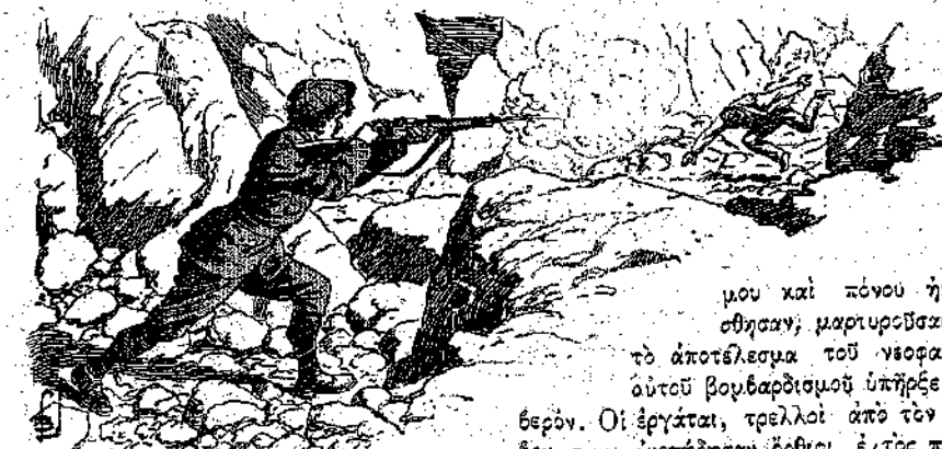
Ο Μαρκήσιος έπεσε κάτω... (Σελ. 367, στ. β')