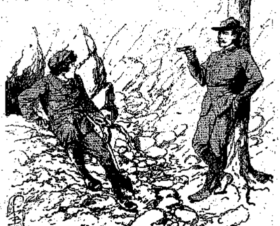
«Δουλειά! ειδεμή σου την άναψα!...» (Σελ. 368, στ. β')

Και χωρίς να φανή, επεδρόμυνε την εργασίαν του, έλαίξων ότι όλίγον κατ' όλιγον ή επίδρασις του Κατακτητού θα έγινετο όλιγώτερον άυστηρά, ότι εις μίαν στιγμήν αφαιρέσεως, ημπορούσε να ση-κώση τα μάτια του από πάνω του... Άλλά και τί άλλο από μίαν στιγμήν έχρειάζετο εις τον Τζούλην, δια να τραθήξ, από το στή-θος του, το όπλον του