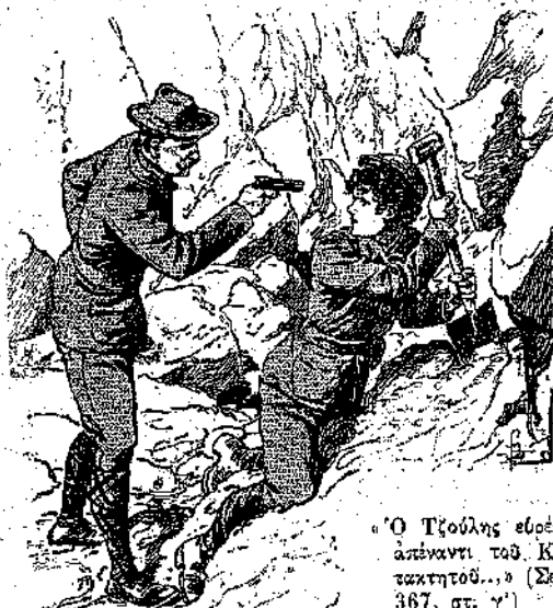
Ο Τζούλης εύρεθη άπέναντι του Κατακτητού... (Σελ. 367, στ. γ')