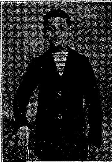
Τσοῦ, ως σ'ές υπαχέθη, ή εικόνη του άλη...