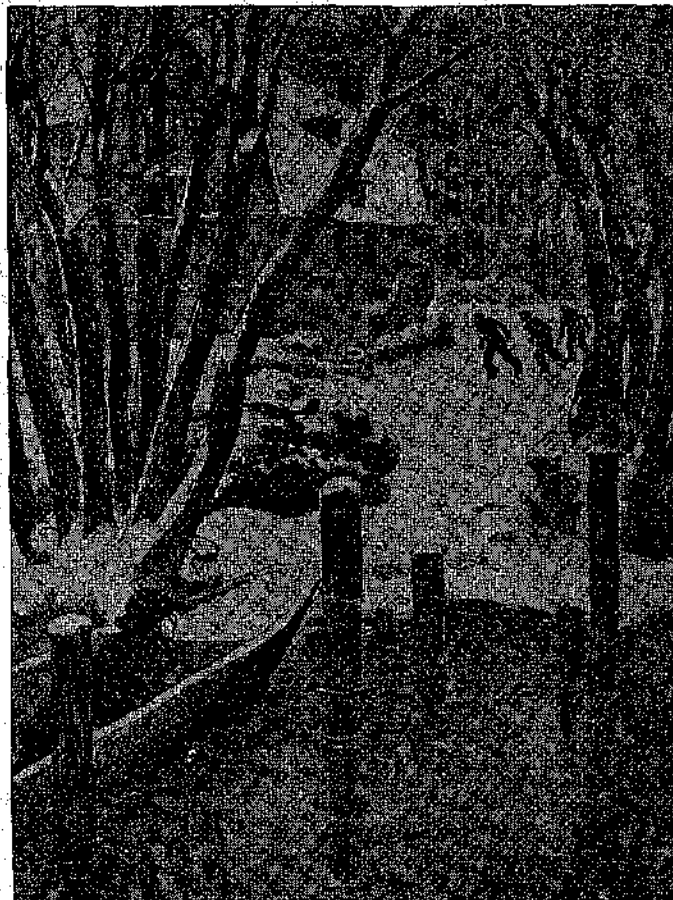
Ἐρβελίν, μέσα εἰς τὴν βαρκούλαν του, ἔτρεμαν ἀπὸ ἀγωνίαν. (Σελ. 365, στ. γ')