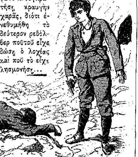
«Ο Τζούλης εκύτταζε με πρόμον τον έχθρον του κατακείμενον...»