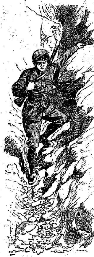
Η δυσχερής κατάβασις... (Σελ. 367, στ. α')