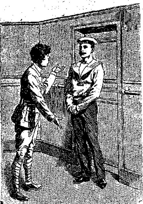
«Ο Τζούλης δέν είχε κατορθώση ακόμη νά πληρώσῃ τόν κ. Ρισανέλ...» (Σελ. 70, στ. α')

Με μυρίας προσφύλαξεις, προσέχων πρό πάντων νά μή προσκόπτουν τά πόδια του εις τά σιδηρά σκαλοπάτια, ήρχισε νάνα-