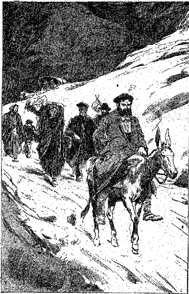
«Μία γραφικωτάτη πομπή περνούσε...» (Σελ. 5, στ. α.)

—“Οχι. Θα το θεωρούσα μεγάλη μου εύτυχία, αλλά είχα γύριση και στην Άγγλία, όταν ξεκινούσ' εκείνος. ‘Όσο για το αυτόγραφο του, συμφωνώ ότι θα ήταν λαμ-