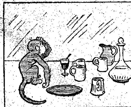
— Πώς να σηκώσω τώρα όλ' αυτά τα ποτήρια; Γιά, να ιδούμε!...