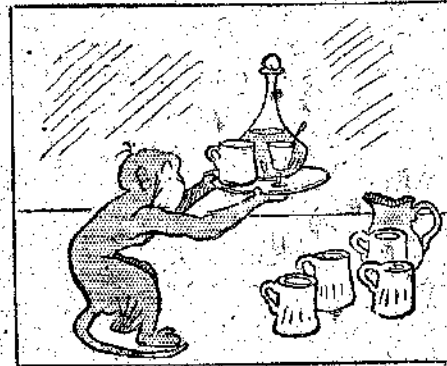
— ‘Ο δίσκος δεν τό χωρεί και θάναγκα-σθώ να κάμω κι' άλλο δρομο...Τι να κάμω;