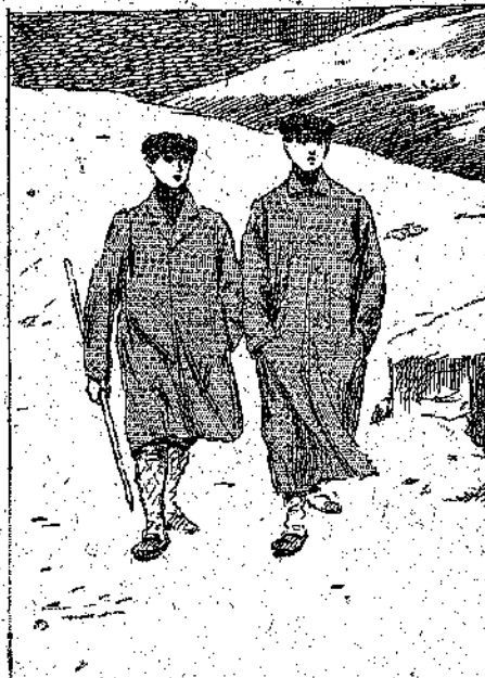
«Με γοργό, ζωηρό βήμα...» (Σελ. 4, στ. ε.)

Οι δυο άδελφοί στάθηκαν λίγο παράμερα, για ναπολαύσουν με την ήσυχία