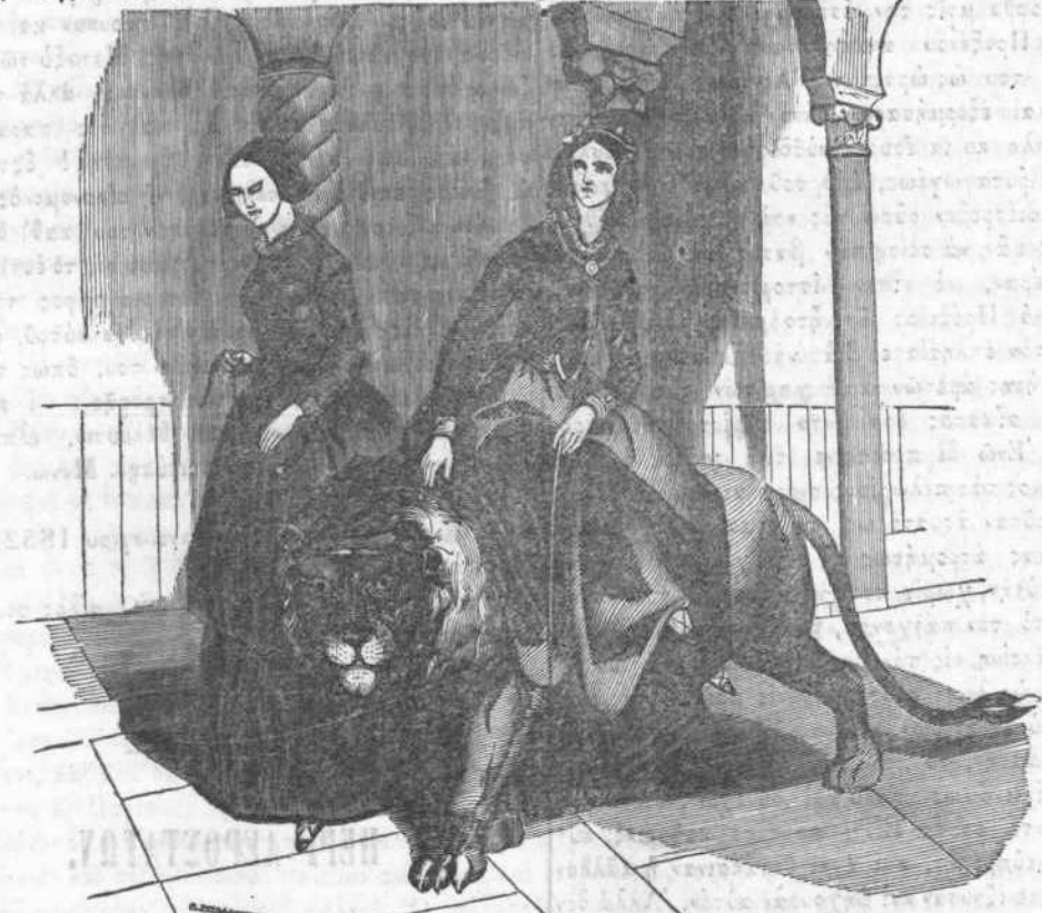
Λέων τιθασὸς ἐν Ἀλγερία.

ληλον εἰς τὴν τελευταίαν του παρατήρησιν, ἐὰν δὲν ἠνοίγετο ἡ θύρα τῆς αἰθούσης διὰ τὰ εἰσελθεῖν. Ἀλλὰ φαντάσθητι, φιλε, ὅποια ὑπῆρξεν ἡ ἰδική μου ἐκπλήξις, ὅταν πλησιάσας τὴν ὄραϊαν τοῦ Πραξένου κόρην διὰ νὰ τῇ προσφέρω τὸ σέβας μου, εἶδον, ὅχι τοὺς ἀνθρωπομόρφους λέοντας, περὶ ὧν συνωμίλουμι μετὰ τοῦ συντρόφου μου, ἀλλ' ἀληθῆ λέοντα ὑπερμεγέθη καθήμενον μεγαλοποιπῶς παρὰ τοὺς πόδας τῆς. Ἐχαίρετίτα τὴν αἰκοδέσποιναν; ἠρώτησα περὶ τῆς ὕψους τῆς; Δὲν ἐθυμούμαι τίποτε τοῦτο μόνον τὸ λέγω ὅτι μεγίστη, ὡς φαίνεται ὑπῆρξεν ἡ ἔκστασις μου διὰ τὴν ἀπροσδόκητον καὶ ἀνεξήγητον ἐκείνην σύμπτωσιν ὅτι, ὅταν μετ' ὀλίγον ἀνέλοθον, εἶδον τοὺς περιστάτας ἔχοντας τὰ βέβηματα προσηλωμένα ἐπάνω μου καὶ μειδιώντας, καὶ μετ' αὐτῶν γέλωτα γέλωτα ἄκρατον τὸν νέον σύντροφόν μου. Δὲν παύθηθον, με εἶπεν, οὔτε δέκα λεπτά τῆς ὥρας ἀποῦ μόνος ἐπλεξας τὸν πανηγυρικὸν τῶν λε-