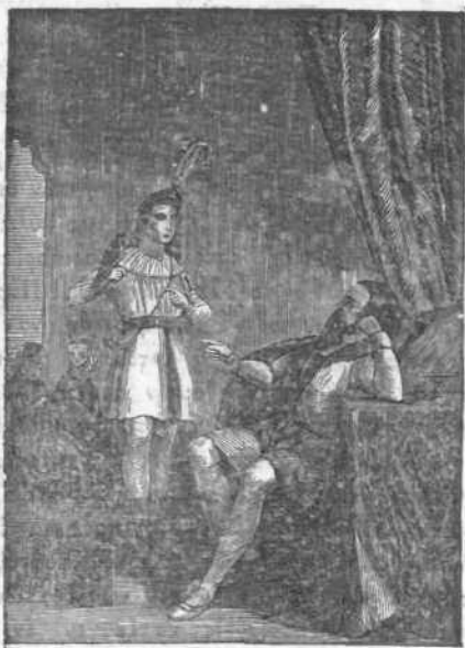
Ὁ Διέτριχος ἐξετάζων τοὺς ἱερακας τοῦ Ὀθωνος

Ὅταν δ' ἡ θύρα τῆς αἰθούσης, ἐν ἣ ἐκάθητο ὁ ἄρχων, ἠνεώχθη δὲν ἠδυνήθη νὰ κατασιγήσῃ ἐνδομυχῶν τρόμῳ· ἀλλ' ἀνέλαβε θυβῆος καὶ εἰσῆλθε πολυηρῶς. Ὁ Διέτριχος ἦτο ἡμικεκλιμένος ἐπὶ ἀνακλινηρίου, ἔχων παρ' αὐτῷ μέγα κύπελλον οἴνου, καὶ διασκεδάζων διὰ τῆς βοῆς κύβων ἐπὶ τοῦ ταπητός. Ἡ δὲ Ματίλδη καὶ ἡ Ἀγὴ καθήμεναι πλησίον αὐτοῦ εἰς τράπεζαν, ἐκέντων.