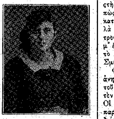
ΚΟΡΗ ΤΩΝ ΚΥΜΑΤΩΝ, έν Αθήναις. Πρώτον Βραβείον Δεκάτου Έβδομου Διαγωνισμού Εσκαπθώματος.

Άυρτων τους διηγήθηκε με λίγα λόγια τα συμβάντα, τουλάχιστο όσα ήξερε.