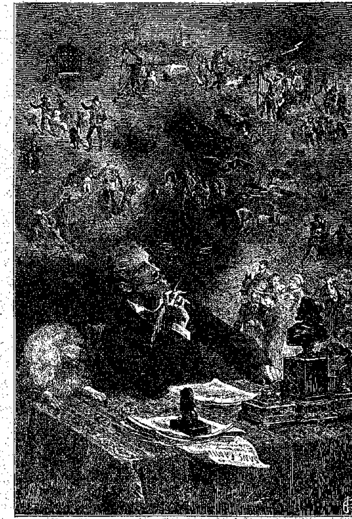
Ο ΕΚΤΟΡ ΜΑΛΟ ΣΤΟ ΓΡΑΦΕΙΟ ΤΟΥ Ἐμπνευσμένος, σχεδιάζει τὸ «Χωρὶς Οἰκογένεια» καὶ δραματίζεται τὶς κυριώτερές του σκηνές.

δὴ δὲν ἐδλεπετε, — παρὰ λιγοστὰ χωράφια καλλιερρημένα καὶ παντοῦ μεγάλους χερσότοπους, ὅπου δὲν ἐφύτρωναν παρά ρεῖκια καὶ γαζουράγκαθα. Στὴν ἀπέραντὴ αὐτῆ ἐρημιά, ἐδλεπετε κάπου-κάπου, στὰ ψηλῶματα, καὶ κανέν' ἀρρωστιαρικο δέντρο, νάπλώνῃ κλώνους στραβοῦς, πολυδαπανημένους ἀπὸ τ' ἀγριοβόρια.