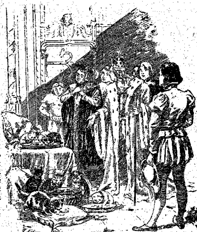
— Βλέπετε, κύριοι; Δεν παίνουν κι' όμως... (Σελ. 389, στ. 7)