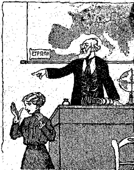
Να τιμωρήσατε τη μαθήτρια Φιροστάτ (Σελ. 129, στ. β').

Η διευθύντρια μπήκε σ' ένα μακρό διάδρομο. Η Ζίνα βάδιζε πίσω της και τ'ά όήματά της της φαινόταν πως άντηχοόζον τρομαχτικά.