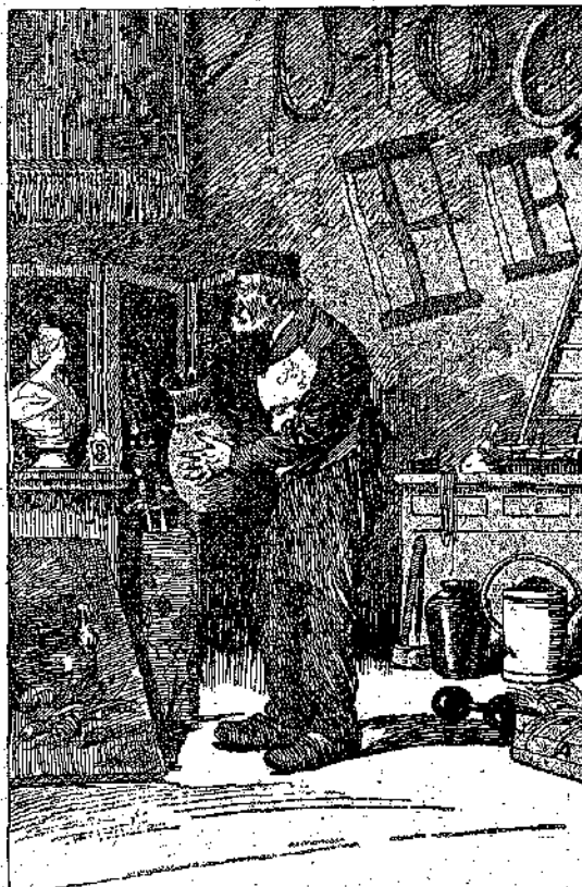
«Ὁ μικρὸς Πρωὶ, ὁ καταστηματοῦχος, ποῦ σὺσε ἀπ' ὀνα.» (Σελ. 162, στ. α')

Διὰ τὸ σὸ Παρθενναγωγεῖο, ἦταν ἕνα «Κατακτημα εἰδῶν πῆγαλε»