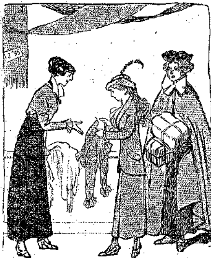
«Εἶχαν ἐπιστρατεύσει σὸς ἐμπορικὰ...» (Σελ. 225, στ. γ')

ἡ κορία Λεγκράν δὲν ἦταν σὸμψωνη. — Δὲ σὸς σὸμβουλεῶ αὐτό, κόρη μου: ἡ φορεσιὰ ἀπὸ τῆς εἶναι τόσο κοντινισμένη δὲν πέρα, ὥστε, ἀν σ' ἐξέλεπαν ἔτσι, θὰ σὸ περνοῦσιν ἀπλοῦστατα γιὰ μιά πραγματικὴ χωρικίση. Εἶναι τόσες ὁπρῆτριες ἀπ' τὴ Βρεττανί ἐδῶ σὸς Ντινάρ!