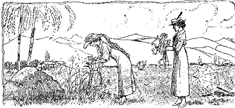
Ἐκεῖναι γουοῦδια γιὰ τὴν Κάρολα...

— Ἡ καμιά σας δὲ θέθελε νὰ πλησιασοῦμε δὲν... Πάντα μοῦ τὸ λέει ν' ἀποφεύγομε τὴν πολυκοσμία... Ἐλάτε νὰ φέγομε.