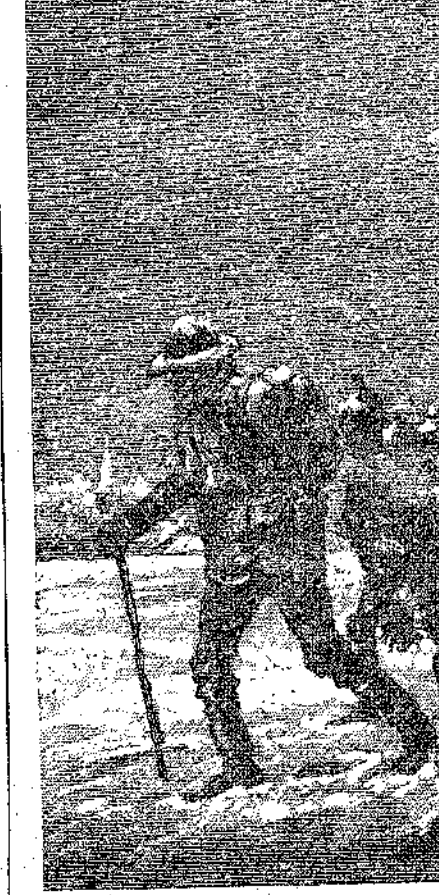
Περπατοῦσαν ζαρωμένα... (Σελ. 341, στ. γ')