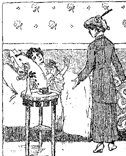
«Μὴν τὰ συλλογίζεσαι αὐτὰ. Περσάμῃ!» ἔκαμῃ! (Σελ. 388, στ. γ')

Λίγες ἡμέρες ὅστερ' ἀπ' αὐτὴ τὴ συνάντηση, οἱ δὲν φιλενάδες ἦσαν στὸν ἀγαπημένο τους περίπατο, στὸ λάκκο μὲ τίς ἄρκουδες. Ἐαφνικὰ ἄκουσαν κοντὰ στὸ μυκλιδῶμα ἕνα φο-