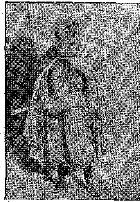
Ἐκδοχ. τοῦ, Ἀφρικαν., Ἰταλικὸ

Ἡ μητέρα καὶ ἡ γιαγιά ἐκλαίγαν καὶ γελοῦσαν, μὰ πάντα ὁ νοῦς τους πῆγαινε στοὺς κινδύνους ποὺ ἐμελλε