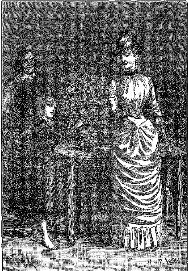
Φέρε μοῦ τὰ στοῦ ἀμάξι, εἶπε ἡ κυρία Λάντη.