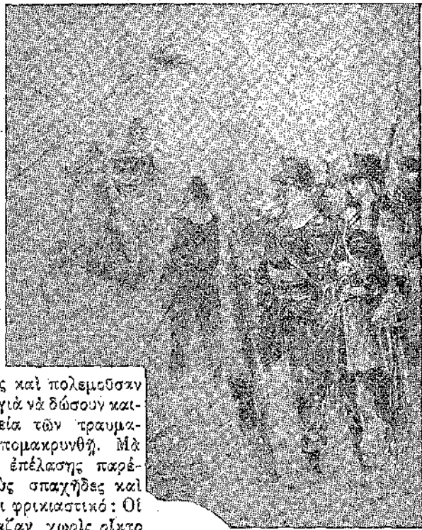
Ἐπίσης κρατῶντες ἕνα τρόπαιον: μιὰ ἐχθρική σημαία». (Σελ. 90, στ. α')

Διοικητὴς τῆς ὀπισθοφυλακῆς ἦταν ὁ ταγματάρχης Σαγκαρνιέ. Διοικούσε ἕνα τάγμα πεζικοῦ, ἱππικὸ καὶ μερικὸς σπαχήδες μὲ τὸν ὑπολοχαγὸν Καρδινιὰκ.