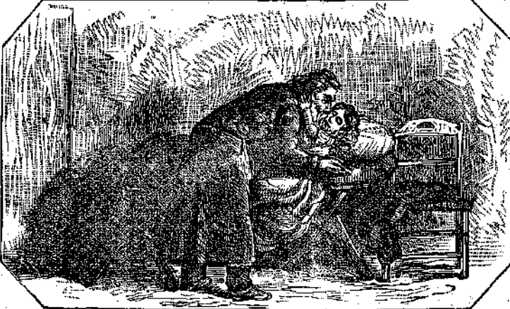
«Ὁ πῶς ὄσε ἀγαπῶ, μπάρμπα-Γεροθωμᾶ!» (Σελ. 183, στ. γ.)

Τὶ νὰ κάμῃ πιά ἢ καίμενη ἢ Μαρίκα; Ἄπαλπίστηκε. Κλαίγοντας, ἔπεσε χάμω. Καὶ τῆς ἐρχόταν νὰ φωνάξῃ: «Ὁ, μπάρμπα Γεροθωμᾶ, μπάρμπα Γεροθωμᾶ! πὺ εἶσαι νὰ ἰδῆς τὴ Μα-