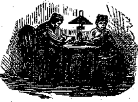
«Κι' έκάθησε κοντά στον άντρα της.»