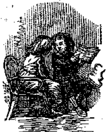
— Αυτό το λένε «Αυγά!»