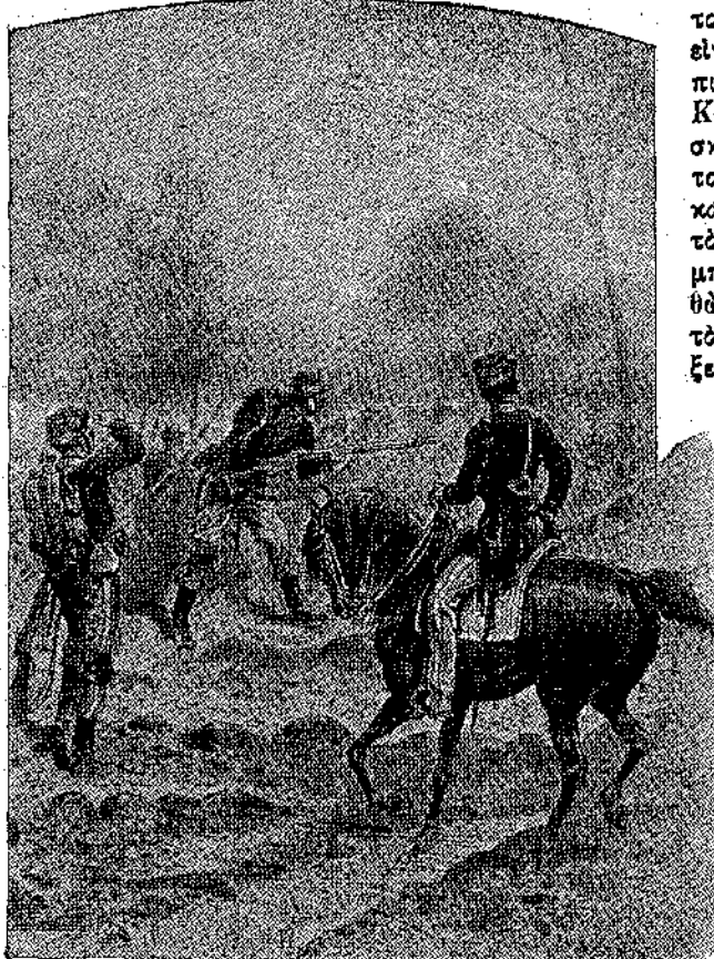
«Οἱ λόχοι τοῦ Σαίν-Σὺρ σκοπεύονται στὴν ἐξοχή.» (Σελ. 146, στ. α.)

Ἰσως εἶναι ἡ πιδὸ εὐτυχημένη περίοδος τῆς ζωῆς τους. Γιὰ πρώτη φορὰ νοιώθουν τὸν ἑαυτὸ τους ἐλεύθερο. Δὲν ἔχει πιδὸ καινοσημοὺς καὶ τύπους. Δὲν ἔχει ὑποχρεωτικὴν ἐργασία οὔτε ἔγνοια γιὰ ἐξετάσεις. Τὸ μέλλον προβάλλει ῥόδινο μπροστὰ τους. Κι' ὁ νέος